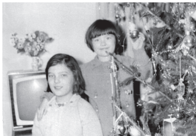
Каждый год с трепетом наряжаю ёлку, чувствуя себя частью чуда. Оно в каждой игрушке, в каждой лампочке гирлянды и хло- пьях конфетти... Оно в прекрасных воспоминаниях об ушедших годах. Фото 1970 г.