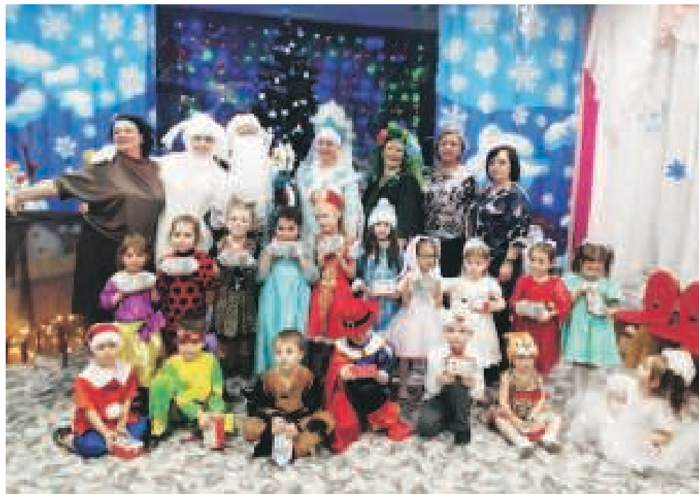
Детский сад «Рыбка», группа №1.