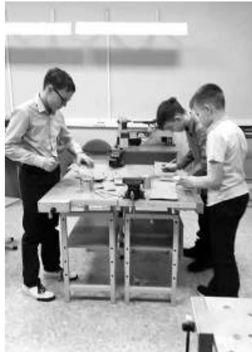
Ребята из гимназии №2 сделали заготовки для 100 окопных свечей.

Прихожане Свято-Покровского храма, которым помогают школьники, вносят свою посильную лепту в поддержку бойцов СВО. Как только был объявлен сбор гуманитарной помощи, женщины стали вязать носки и балаклавы, а с декабря начали изготавливать окопные свечи