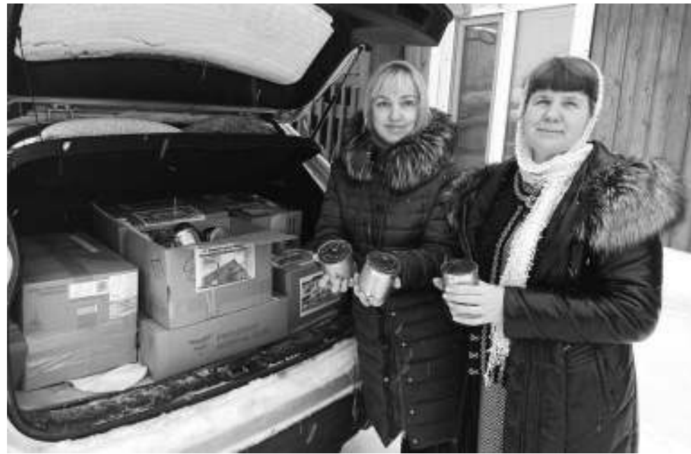
Для отправки в зону СВО готова уже четвертая партия свечей. Большой вклад в это дело внесли прихожанки Свято-Покровского храма — две Натальи.

ции прислали в ответ такое видеосообщение: «Всё пришло в целости и сохранности. Спасибо всем! Коробки со свечами и носками нам тоже передали, но самое приятное, что на свечах и в носках были детские рисунки с пожеланиями. Мы раздали их по ротам, бойцов это очень порадовало».