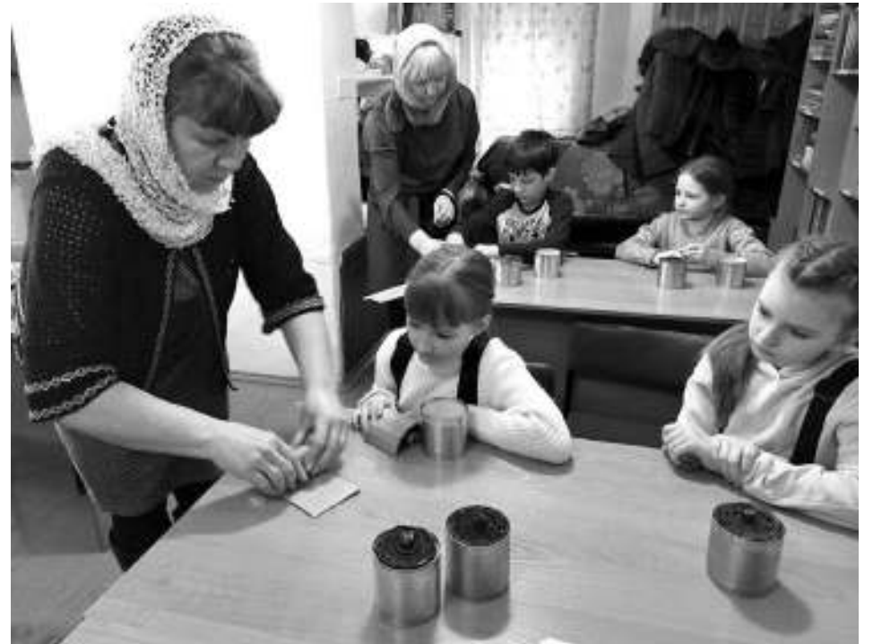
Многие воскресные школы, существующие при томских храмах, занимаются изготовлением окопных свечей. Асиновские дети тоже не остались в стороне.