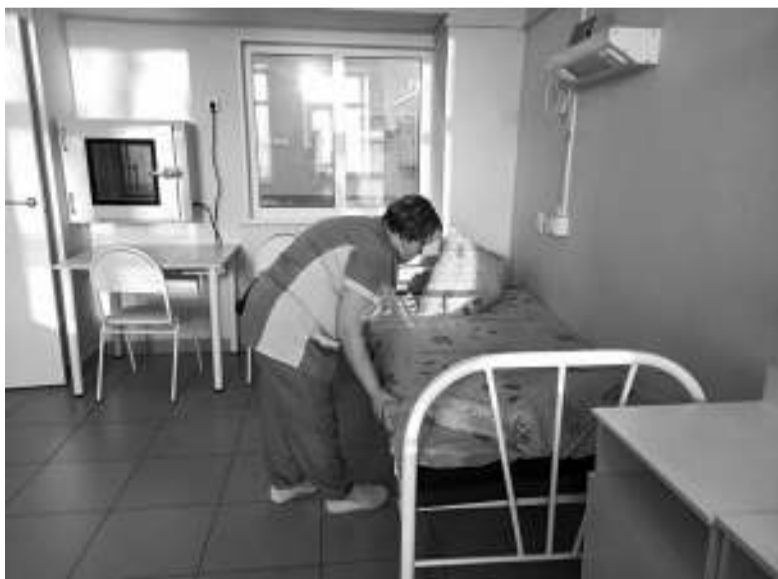
В палатах стало значительно комфортней.

пии, где можно оказать реанимационную помощь пациентам в тяжёлом состоянии, другой предназначен для пребывания людей с ограниченными возможностями. В коридорах на полу уложена тактильная плитка, позволяющая ориентироваться слабовидящим, имеются специальные подъёмники, по-