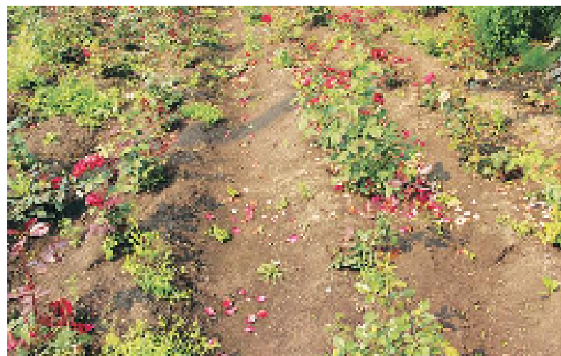
...а таким он стал после визита ночных «гостей».