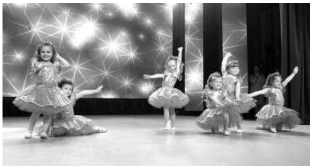
Танец «Маленькие звёзды» в исполнении младшей группы.