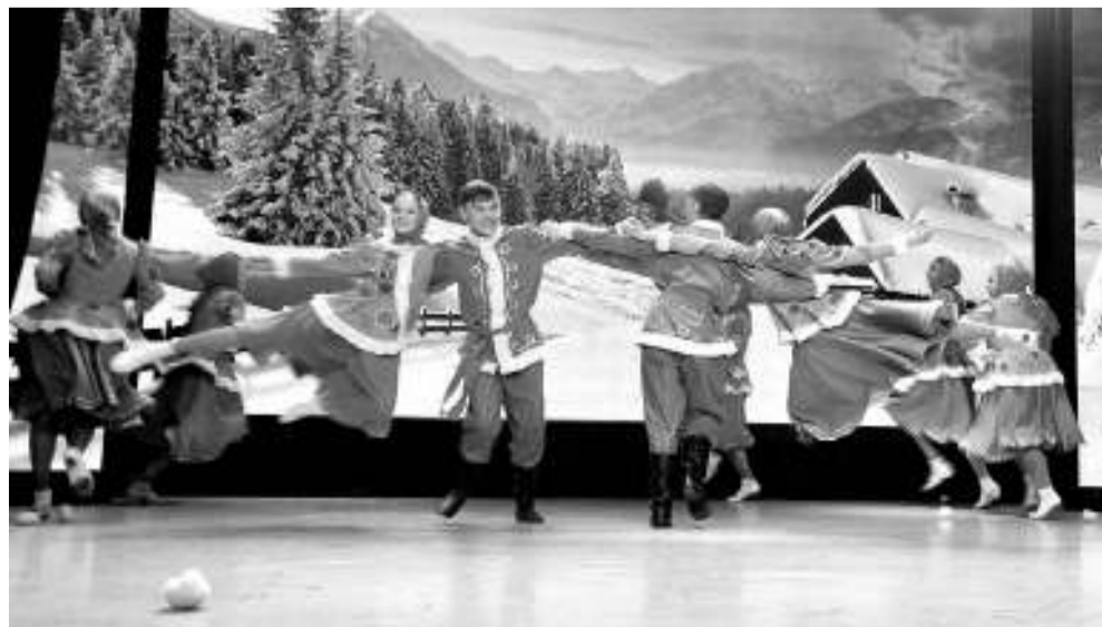
Дебютный танец «Метелица» поразил зрителей своим высоким профессиональным уровнем.