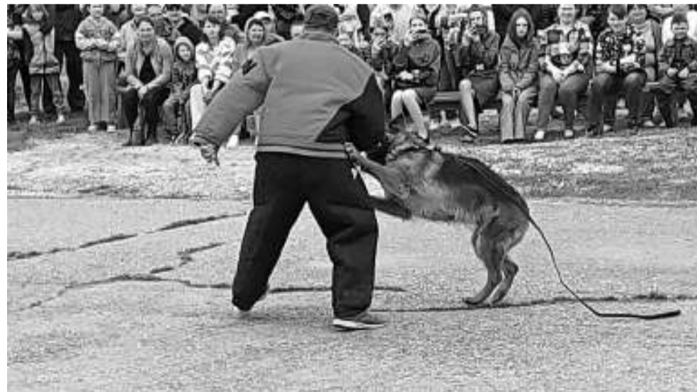
Привезённые из томского кинологического клуба служебные овчарки продемонстрировали свою выучку.

На площади возле Дома культуры, заполненной людьми, вновь были приветствия и поздравления. Глава района и военком вручили пограничникам памятные юбилейные медали. Благодарственные письма от администрации района получили спонсоры праздника. Их было много, потому что материальную часть торжества взяли на себя все те же пограничники. Благодарности за свою деятельность получили и молодые участники патриотических клубов.