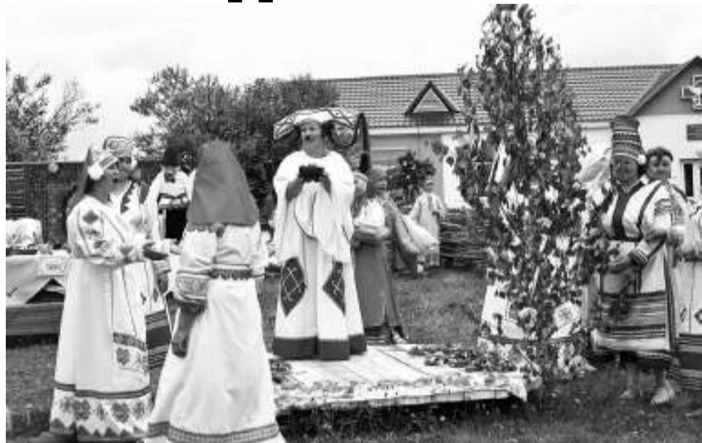
Самым зрелищным моментом фестиваля стала реконструкция мордовского обряда проводов весны.

В этом году фестиваль совпал с юбилеем села. Переселенцы из Тамбовской