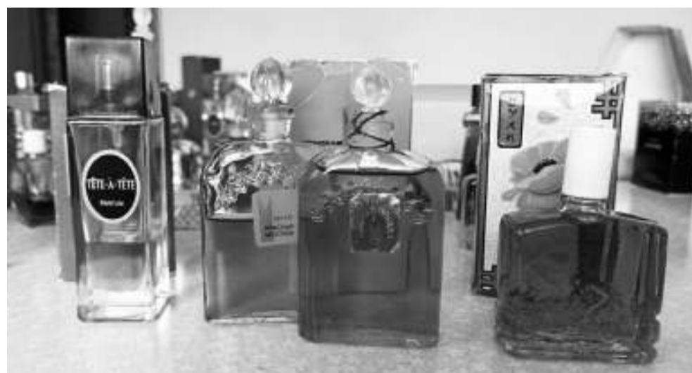
Популярные духи советского периода: «Тет-а-тет», «Красная Москва» и «Красный мак» — являются визитной карточкой коллекции.

Они были придуманы их автором под впечатлением премьеры балета Рейнгольда Глиэра «Красный мак», состоявшейся в июне 1927 года, и впервые выпущены к 10-летию Великого Октября. На сегодняшний день этот парфюм не производится, но я приобрела его с запасом и активно пользуюсь. Духи «Злато скифов» начали выпускать ещё в двадцатые годы. Таких древних у меня нет, но семидесятого года выпуска имеются. Кстати, в 1958