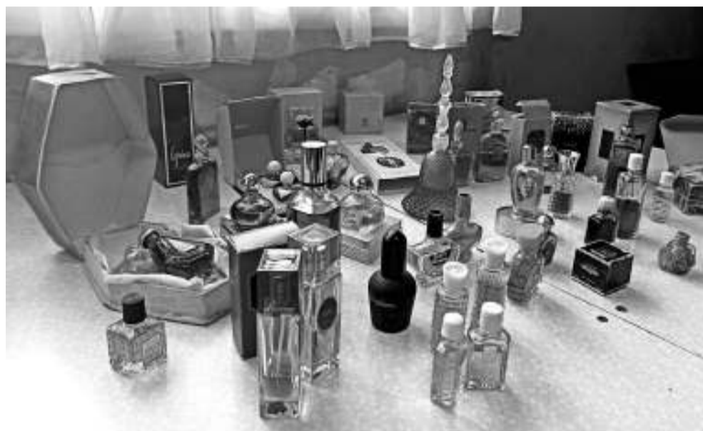
Сколько всего у неё духов, обладательница коллекции не считала, но предполагает, что больше ста.

году они были удостоены награды на международной парфюмерной выставке в Брюсселе. Ещё одна визитная карточка фабрики «Новая заря» — духи «Тет-а-тет». Они стали совместным творением «Союзпарфюмерпрома» и французской марки Marbel. А это её величество «Красная Москва». У меня два флакончика, один из них — производства 1972 года.