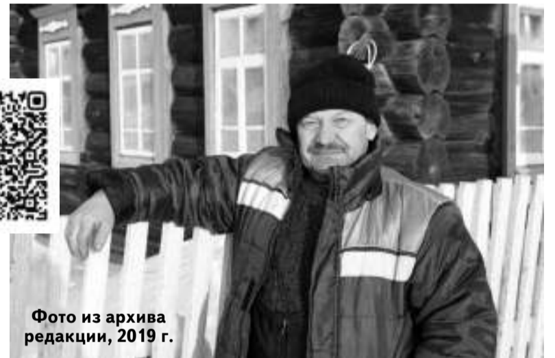
Фото из архива редакции, 2019 г.

«Ещё издали заметил, что из-под крыши дома на улице Томилина вырывается густой дым. Бросился к двери, но она оказалась закрыта на навесной замок. Услышал, что за дверями кто-то громко скулит. Звук был какой-то нечеловеческий, поэтому подумал, что это собака. Жаль стало животину. Нашёл топор в сених и со второго удара сбил петли. Когда распахнул двери, даже обомлел: на пороге стоял заплаканный пацанёнок, а за его спиной горела стена кухни. Рассмотреть