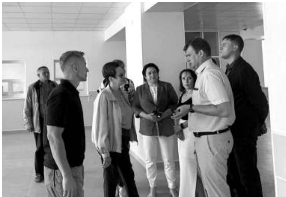
Сдача новой детской поликлиники намечена на осень.