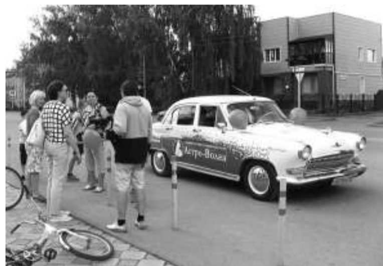
Ретроавтомобиль ГАЗ-М-21 «Волга» 1964 года выпуска заинтересовал многих асиновцев.

Автомобиль вызывает массу положительных эмоций у детей, они с большим удовольствием садятся в него и держатся за руль. Взрослые с интересом рассматривают машину, которая серийно производилась на Горьковском автомобильном заводе с 1956 по 1970 годы. Теперь её не часто встретишь на дорогах. Конечно же, было много желающих сфотографироваться с авто из прошлого.