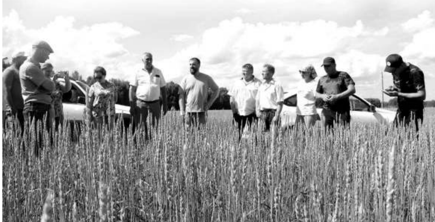
Представители сельхозпредприятий трёх районов: Асиновского, Зырянского, Первомайского — оценили состояние производственных полей.

Засушливые май и июнь свели на нет надежды аграриев на хороший сельскохозяйственный год