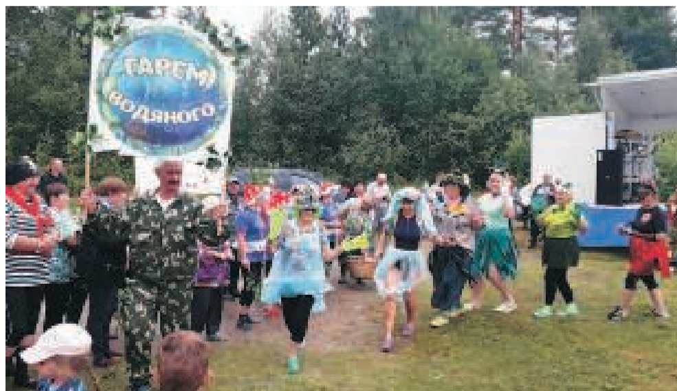
Асиновский «Гарем водяного» занял второе место.