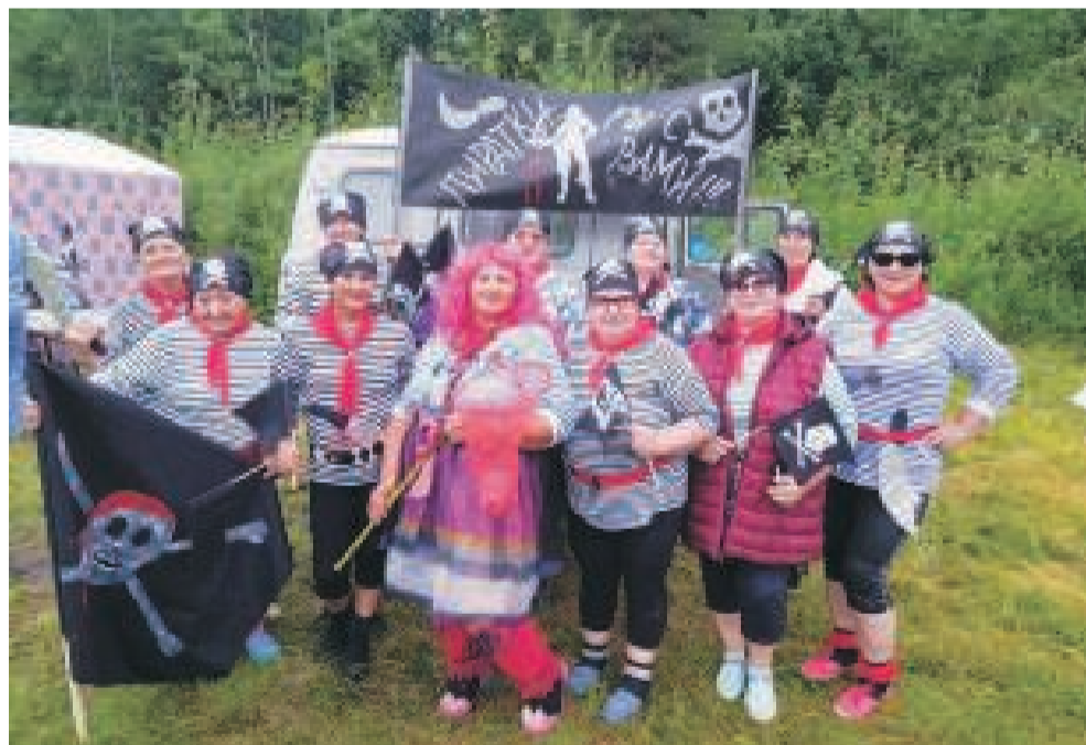
Гран-при конкурса достался команде «Улулюльские пиратки».