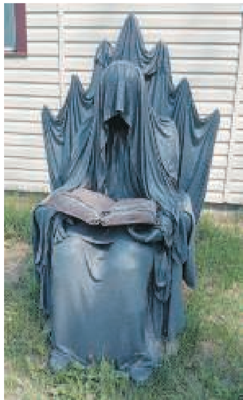
Олеся Визер увлекается созданием скульптур из ткани и цемента, из этого же материала она создаёт необычные предметы интерьера.

Олеся повезло, что у мужа золотые руки. Он сам построил баню, беседку, соорудил теплицу, для дочки Ульяны качели на цепях поставил.