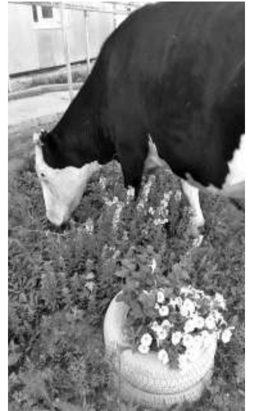
Цветы на десерт с городской клумбы.