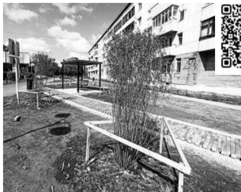
У МКД по ул. Ленина, 4 высажены деревья, кустарники и многолетние цветы, большинство из них огорожены.

Асиновцы переживают за новые посадки, появившиеся на улицах города