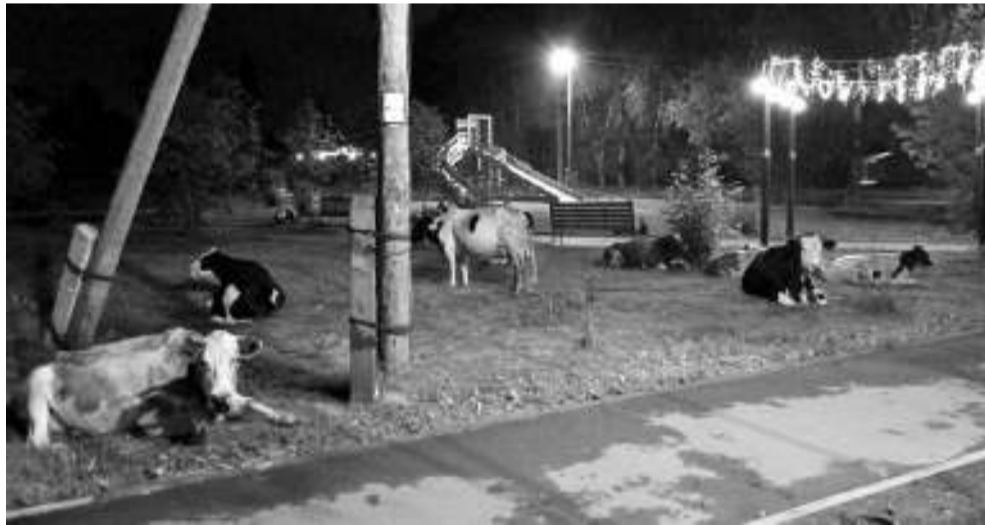
Коровы настолько адаптировались в городской среде, что нашли себе летнюю квартиру в сквере около налоговой, устраиваясь там на ночлег.