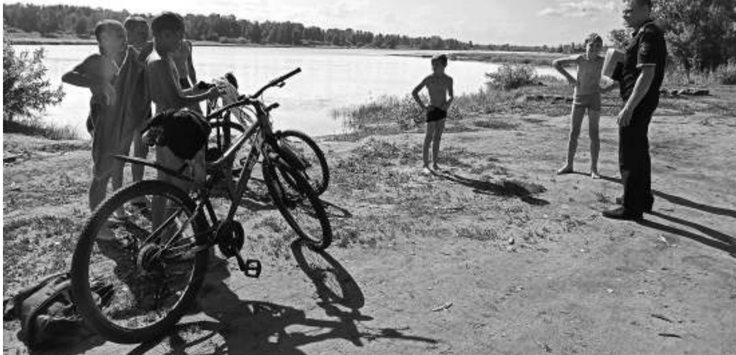
Участники рейда застали группу подростков на озере Закрома без присмотра взрослых.

Организаторы рейда обращаются к асиновцам: прежде чем садиться за руль велосипеда, а уж тем более обучать езде своих детей, внимательно изучите ПДД. Когда на дороге страдают дети, виноваты всегда взрослые, потому что не научили своего ребёнка правильно вести себя в условиях современного города или продемонстрировали плохой личный пример. Трагедии на воде — тоже зачастую результат бесконтрольности со стороны взрослых. Не отпускайте детей одних на водоёмы: случись что с ребёнком — всю жизнь придётся винить только себя.