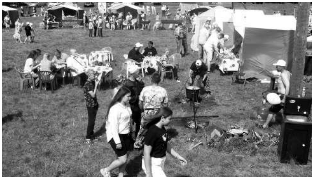
Гости праздника могли не только поболеть за резвых лошадей и их хозяев, но и принять участие в разнообразной культурной программе, посетить торговые ряды, отведать горячей ухи.

Когда улеглась пыль на беговой дорожке, стихли звуки музыки, стали сворачивать работу площадки, народ не торопился покидать уютную поляну ипподрома. Очень уж хороший выдался день, и хотелось ещё побыть на природе и радоваться летнему солнышку.