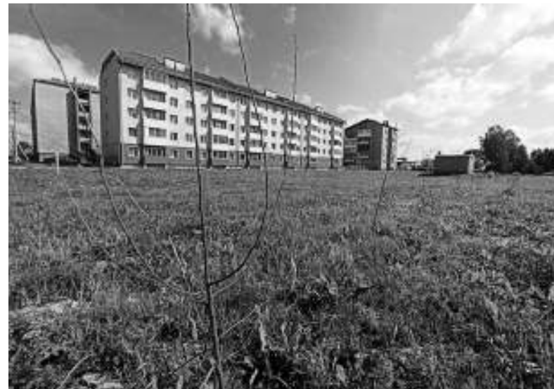
Пустырь у дома по ул. Липатова, 14-а скорее всего так и останется пустырем.

Город озеленяют не только для красоты и уюта. Зелёные насаждения очищают воздух, кроны деревьев отлично поглощают шум автомобильного транспорта, удерживают ветер и частицы пыли. Но для того, чтобы они жили, росли и радовали людей, о них надо позаботиться.