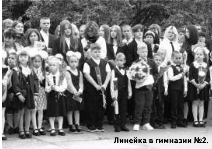
Линейка в гимназии №2.

В День знаний школа №4 и гимназия №2 распахнули свои двери после капитального ремонта