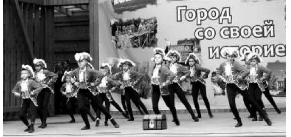
На сцене — ансамбль эстрадно-спортивного танца «Кристина».

Несмотря на хмурую погоду, праздник получился замечательный. А у тех, кто не смог присутствовать на мероприятии и выбрать для себя понравившееся направление, ещё есть время.