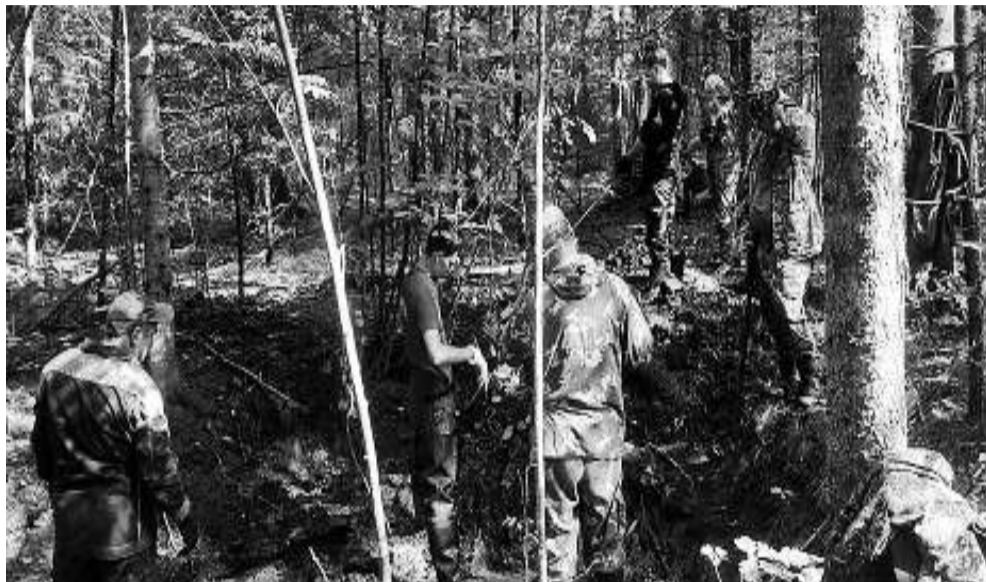
В воронке от разрыва снаряда были обнаружены останки девяти солдат.

Отряд состоял из 12 человек: 7-ми взрослых и 5-ти детей. Из лагеря выезжали в 9 утра, возвращались в 7 — 8 вечера. Ехать к предполагаемым местам боевых сражений нужно было от 15 до 30 километров. Поиск погибших бойцов велся в Старорусском районе Новгородской области на основе архивных документов. Местность предварительно проверялась электронными приборами, позволяющими обнаружить металл. Если у солдата было что-то металлическое: патроны, ложка, медальон, кружка, фляжка, пуговицы, каска и т.д. — это значительно ускорило поиски. Копали лопатами, затем буквально по сантиметру, слой за слоем