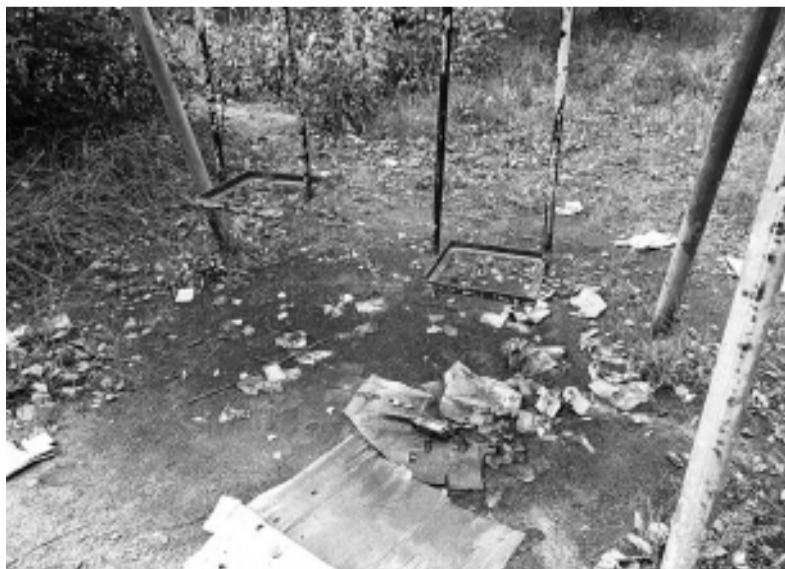
Детские площадки, которые были подарены когда-то юным асиновцам коллективом ДРСУ, находятся сегодня в аварийном состоянии и на самом деле представляют опасность.

В асиновских дворах эксплуатируются площадки, выпущенные до всяких регламентов и без сроков эксплуатации, поэтому, следуя здравому смыслу, можно сделать вывод, что нормы регламента на них не должны распространяться, но почему-то именно им решили следовать вместо того, чтобы не сносить, а просто привести площадки в порядок. Всё как всегда упирается в деньги. Городу даже не на что пока восполнить демонтированные этим летом элементы на центральной детской игровой площадке, о каких дворах может идти речь? Получается, только радикальными мерами можно уберечь ребятшек от травм, а чиновников – от ответственности. Как говорится, нет площадки – нет проблем! А дети? А дети вырастут как-нибудь и без дворовых качелей и горок, ведь, как заметили в городской администрации, в каждом микрорайоне есть альтернатива – общегородские пространства отдыха и развлечения, оборудованные по всем нормам. Вот только и у самих ребятшек, и у родителей на это найдётся много вполне оправданных возражений.