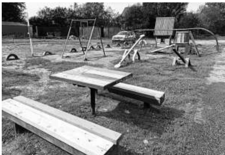
За площадкой на улице Ленина, 71 жильцы постоянно ухаживают и не понимают, почему она попала в список для демонтажа.