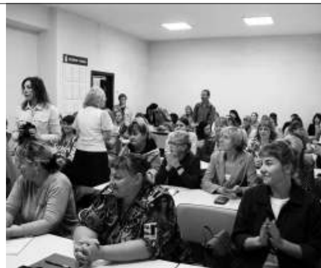
На смену двум группам, обучающимся сейчас сестринскому делу на базе АТпромИС, придёт самостоятельный Асиновский медицинский колледж.

В 2024 году должны подготовить проектно-сметную документацию на ремонт двух зданий, в 2025 году пройдут необходимые работы, после чего в Асине будет открыт не филиал, а отдельный медицинский колледж с несколькими направлениями обучения.