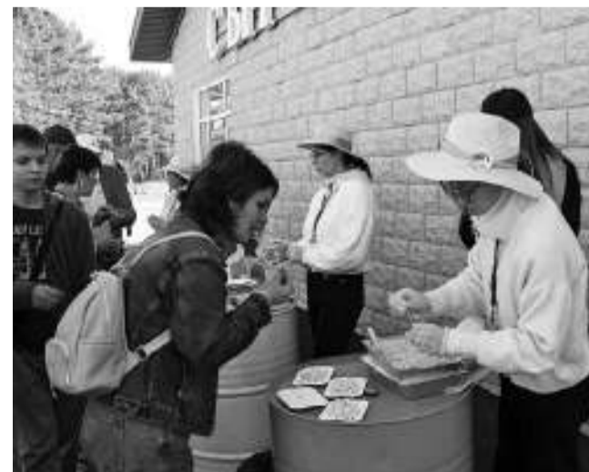
Целые очереди выстроились к столам дегустации сыров местного производства.

Все хотели погладить ласковых и миниатюрных бурёнок породы Джерси. Ребятишки с удовольствием пили их свежее молоко.