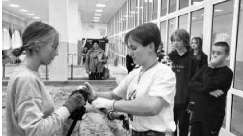
Учащиеся пятой школы во время экскурсии осваивали монтаж системы водопровода.

До конца недели планируется ещё много событий: праздничный концерт, квест «Педагогам от студентов», велопробег, а также участие в областных мероприятиях.