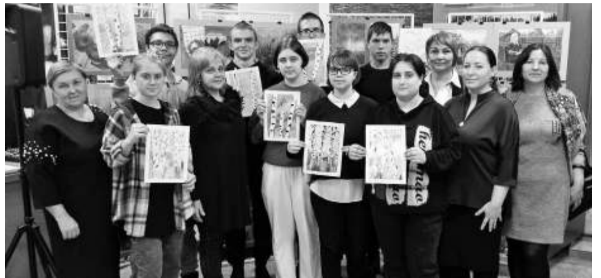
На память о музейной встрече у участников остались пробные работы по живописи.

Она началась 65 лет назад с открытия музыкальной школы