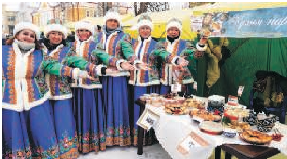
Коллектив «Журавушки» для участия в гастрономическом фестивале взял за основу кухню народов Сибири: тюрков, хантов, сибирских татар.

Особый интерес не только у детей, но и у взрослых вызвал мастер-класс от педагогов АТпромИС по изготовлению флюгеров, которые используются для определения направления ветра и могут служить детской игрушкой. Работала ярмарка-продажа изделий местных мастеров, где