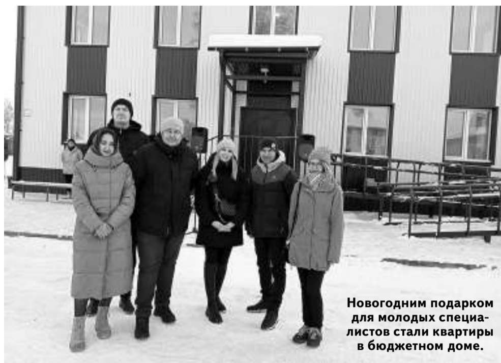
Новогодним подарком для молодых специалистов стали квартиры в бюджетном доме.

— Идёт подготовка проекта строительства большого мусорного полигона,