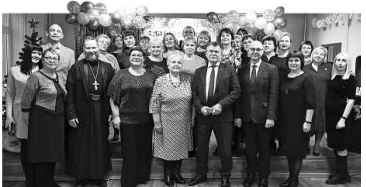
Виновники торжества сфотографировались на память с гостями праздника.

Украсили праздник творческие номера от асиновских и новокусковских артистов, а также от самих хозяев праздника.