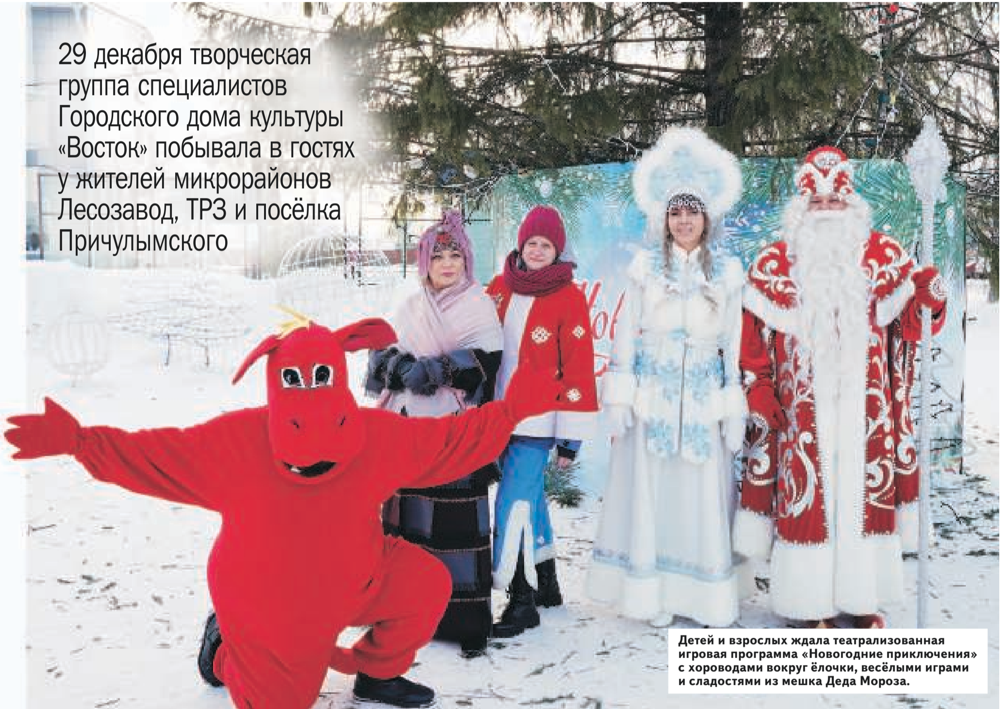
Детей и взрослых ждала театрализованная игровая программа «Новогодние приключения» с хороводами вокруг ёлочки, весёлыми играми и сладостями из мешка Деда Мороза.

29 декабря творческая группа специалистов Городского дома культуры «Восток» побывала в гостях у жителей микрорайонов Лесозавод, ТРЗ и посёлка Причудымского