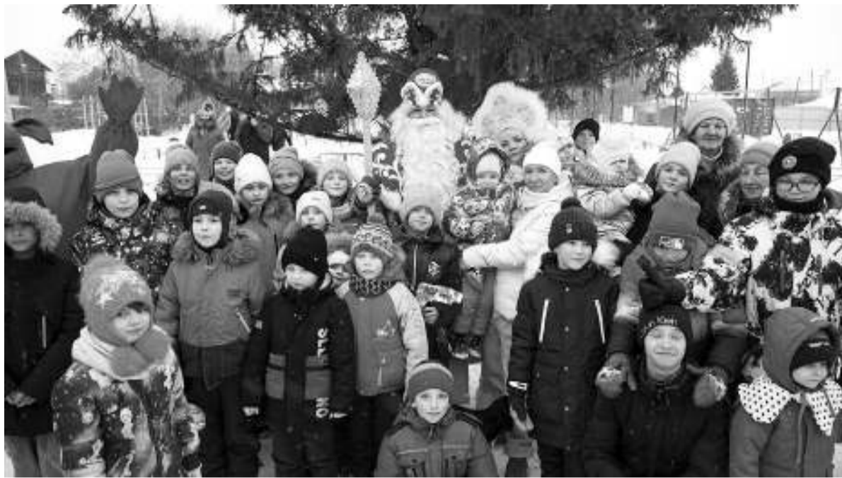
Жители микрорайона Лесозавод дружно встречали новогодних героев.

Перед Новым годом и в январские праздники жизнь кипела и в культурно-туристическом комплексе «Сибирская усадьба Н.А.Лампсакова». Двери резиденции Деда Мороза там распахнулись 23 декабря. Необычное новогоднее представление «Дело 2023/4» уже одним своим захватывающим названием привлекало гостей всех возрастов. В нём всё было необычно, даже Дед Мороз, который приветствовал собравшийся народ на тувинском языке и развлекал игрой на национальном инструменте чанза. Накануне Нового года главный волшебник постоянно попадал в неприятности: то валенки от него сбегают, то инструмент музыкальный потеряется. Дедушке понадобилась помощь. В сказочной деревне на этот случай нашёлся свой детектив, которого поддержала ребятня. Посетителям усадьбы надо было и Бабу-ягу допросить, и забежать к сплетнице Ефросинье, и не попасться в руки Атаманши. В общем, скучать не пришлось. Помимо театрализованного представления, гости усадьбы с удовольствием участвовали в творческих мастер-классах по изготовлению новогодних сувениров, посещали интерактивные площадки, катались с горки, а после всех развлечений согревались горячим чаем и сладкими угощениями.