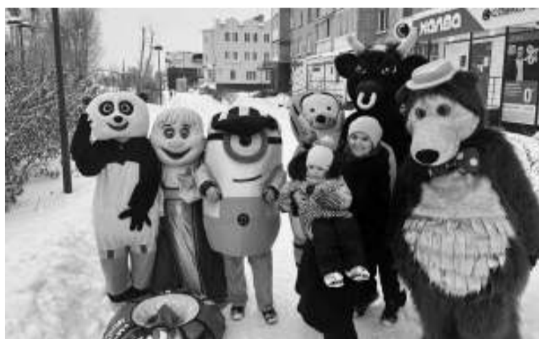
Ребята из молодёжного объединения «Новый Восток» в образах мультяшных героев дарили праздничное настроение асиновцам.

Следующей станцией был Лесозавод, где дети и взрослые тоже увлечённо участвовали в программе. К жителям микрорайона ТРЗ артисты добрались