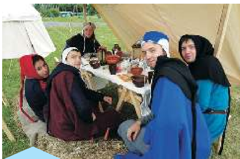
На фестивалях и сборах даже трапеза проходит по средневековым традициям.

Реконструкция — дело непростое. Все костюмы шьются вручную с применением только тех инструментов и тканей, которые были в ту эпоху. К приме-