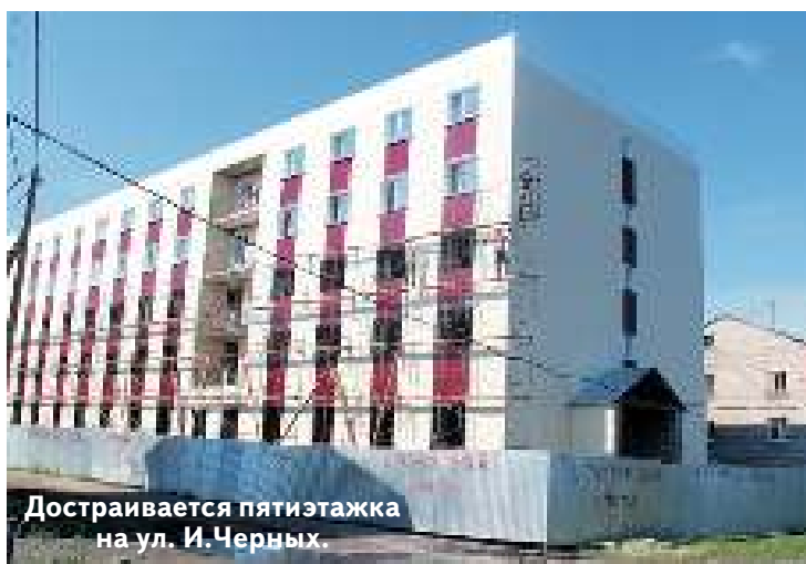
Достраивается пятиэтажка на ул. И. Черных.

Более 600 жителей Асино до весны следующего года передут из аварийных домов в новые квартиры