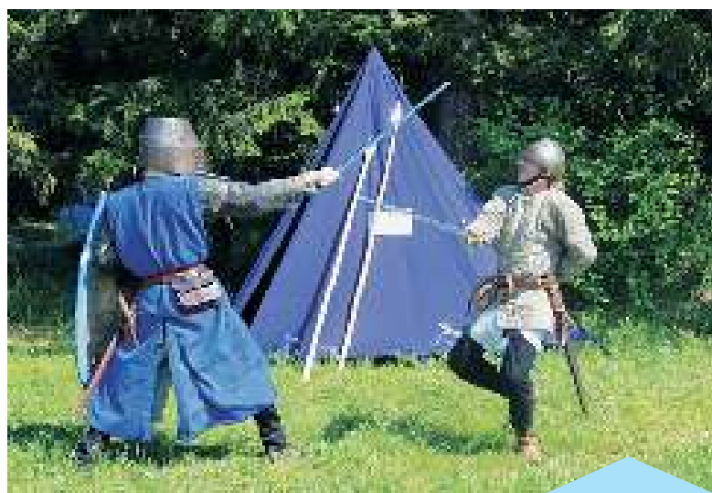
Историческая реконструкция сражения на мечах шведских воинов конца XIII века.

Следует пояснить, что один из главных принципов исторической реконструкции заключается в том, что и