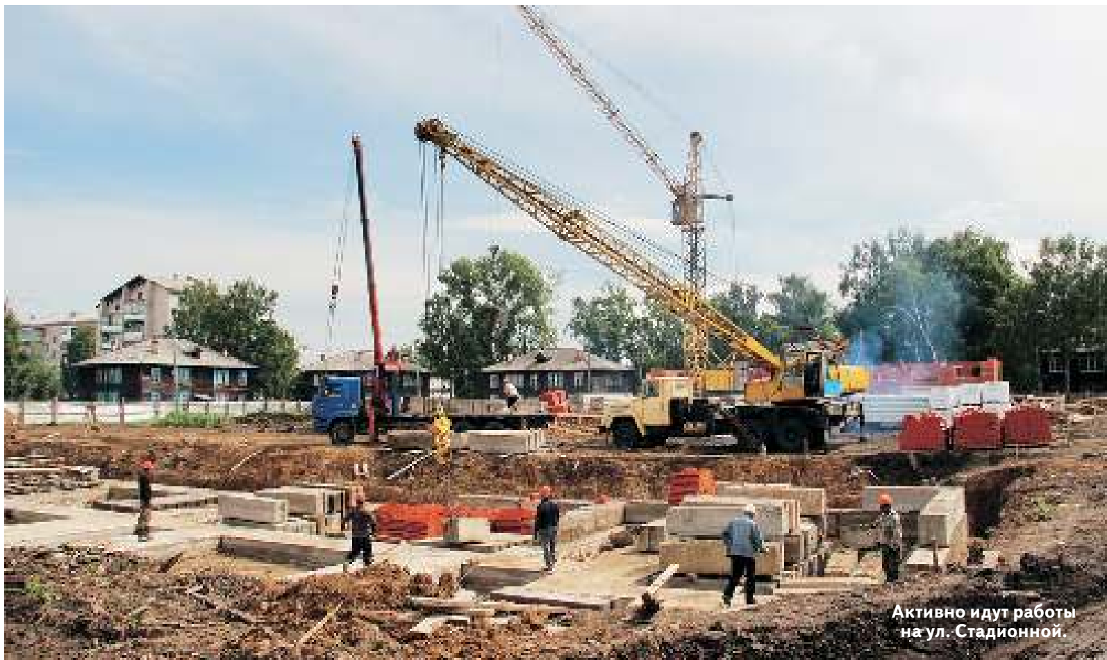
Активно идут работы на ул. Стадионной.

Интернет-версия газеты WWW.OBRAZ-ASINO.RU