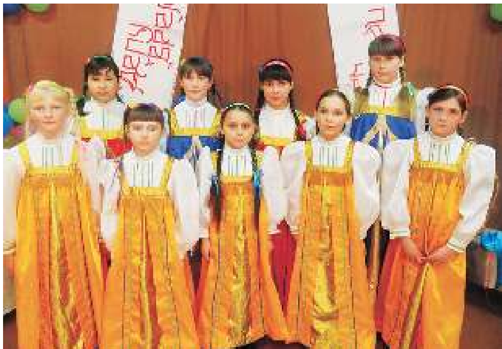
Участники театрального творческого коллектива «Огонёк» на фольклорном празднике «Делу время — потехе час».