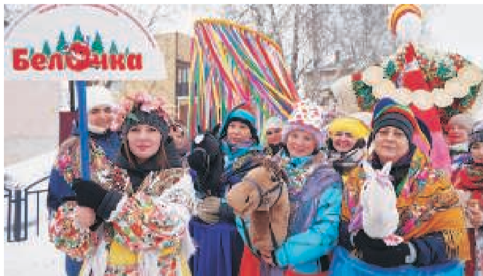
У каждого участника «Потешного поезда» был свой необычный «вагон», который они представляли после завершения шествия. На фото – команды детских садов «Белочка» (вверху) и «Радуга» (корпус 2).

Праздник проводов зимы проходил весело и задорно. Гостей ожидала насыщенная программа с состязаниями, развлечениями и угощениями