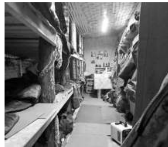
В построенном своими руками блиндаже солдаты постарались создать комфортные условия.

— Помню, что ногу пронзила жуткая боль. Как меня вытаскивали и потом везли в полевой госпиталь, уже помню смутно. Сознание то прояснялось, то вновь пропадало, — говорит мужчина. — Первую помощь мне оказал врач с позывным Турист. Молодец, всё сделал правильно, грамотно. Благодаря ему ногу удалось сохранить.