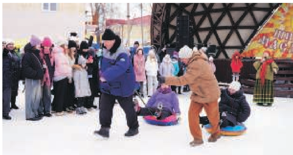
Во время одного из конкурсов зятя катали тещу на плюшках.