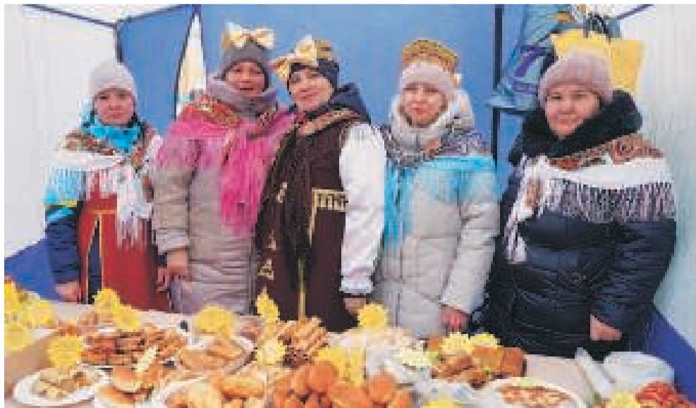
Самый вкусный блин с припёком оказался у хозяйшек детского сада «Рыбка», заслуживших наивысшую награду — Гран-при.

Завершили праздник традиционным обрядом — сожжением масленичного чучела. И хоть оно никак не хотело гореть, пытались распугать народ дымом, но всё же в конце концов сдалось яркому пламени.