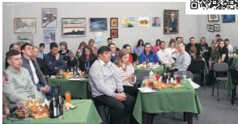
За столами – семьи полиатлетистов, лыжников, шахматистов, теннисистов, хоккеистов и футболистов.