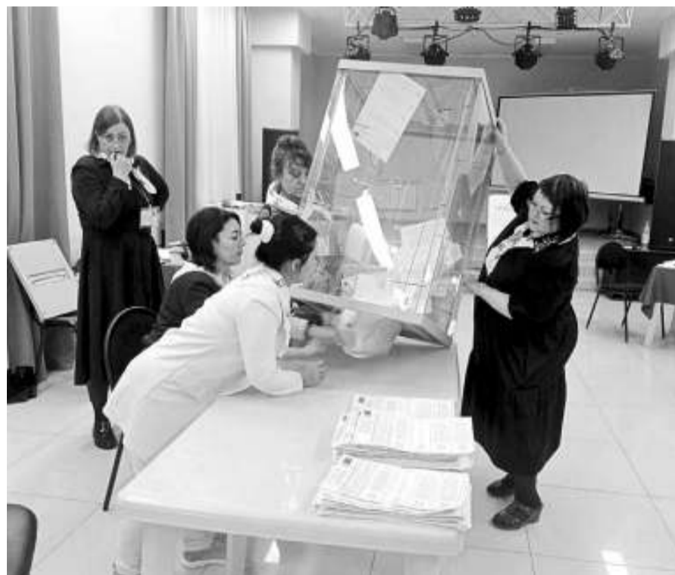
На городском избирательном участке №262, расположенном в ДК «Восток», явка на выборах составила 64,58%.