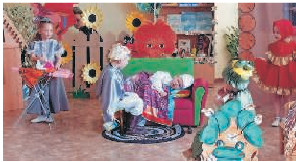
Юные актёры из детского сада «Радуга» (корпус 2) показали спектакль про глупого мышонка.