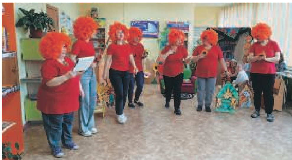
«Рыжая семейка» библиотекарей провела сказочное посвящение всех желающих в свою семью.

Делясь впечатлениями, посетители отмечали, что нынешняя «Библионочь» оказалась интересной и необычной. «Мы сегодня окунулись в тёплую семейную атмосферу. Очень хорошо всё продумано! Есть занятия и для детей, и для взрослых», — такие звучали отзывы. На самом деле, встреча в библиотеке, как и в предыдущие годы, была познавательной и увлекательной. Составляя сценарий мероприятия, его организаторы хотели донести до каждого участника, что посещение библиотеки — занятие семейное. Живое общение в дружелюбной и гостеприимной обстановке оставило массу приятных впечатлений, новых знаний и желание вернуться.