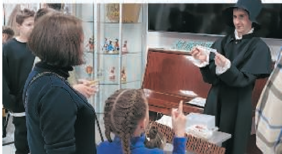
Школьники увлечённо разгадывали загадки, находили фразы, зашифрованные в книжках, и получали за это сладкие призы.