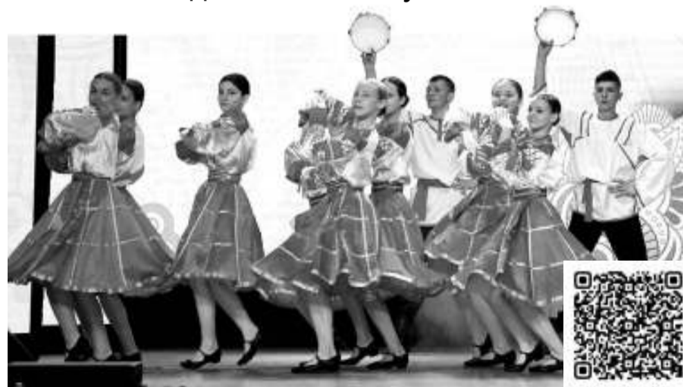
На сцене — театр танца «Фантазёры» и коллектив «Спутник».