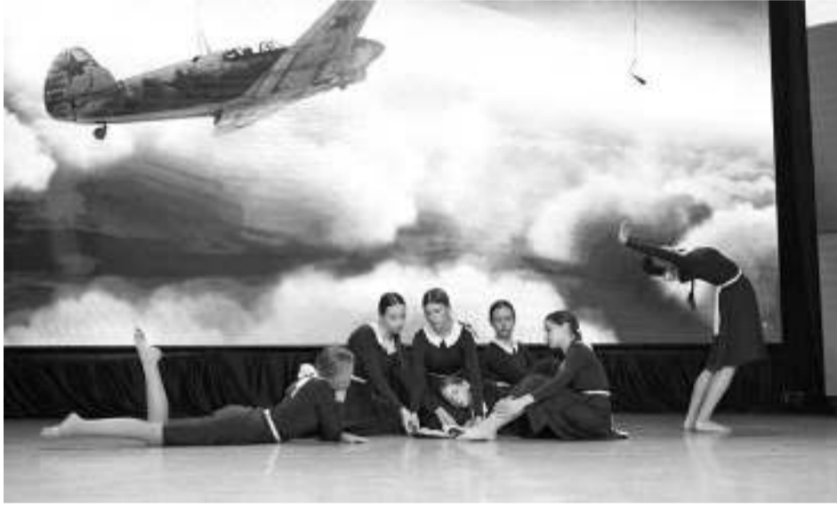
Специальным призом за лучшую постановку на патриотическую тему был отмечен танец «Это просто война» (ансамбль «Веснушки»). Он же признан лучшим в номинации «Современный танец».

20 апреля в Томске на сцене ОДНТ «Авангард» состоялся Всероссийский конкурс «Мир чудес», в котором приняли участие асиновские танцевальные коллективы