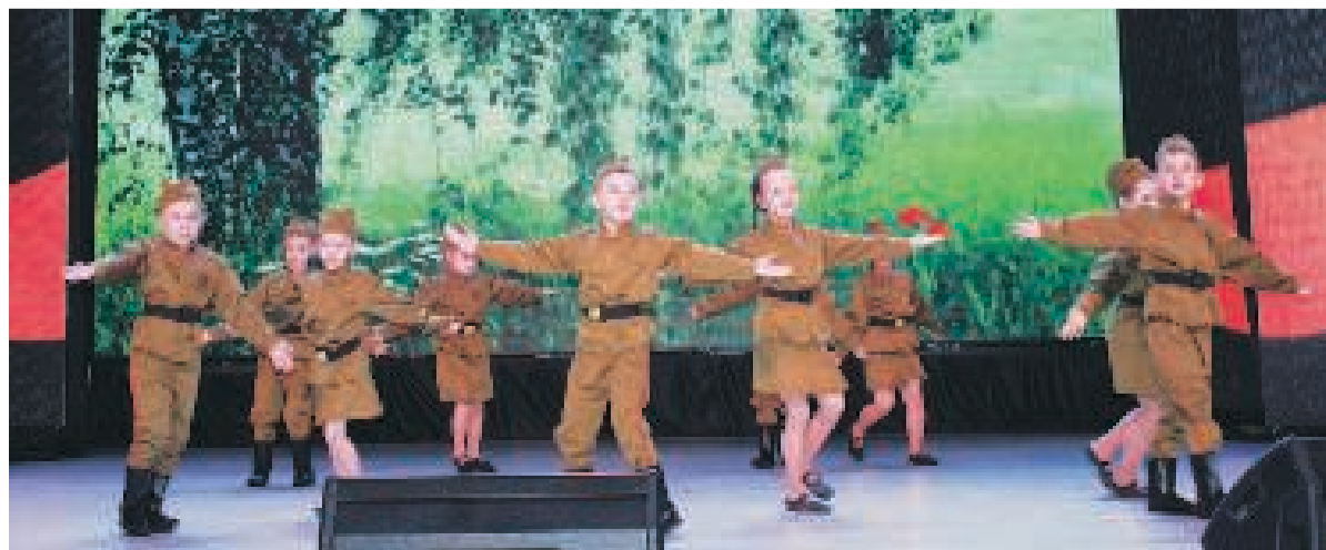
Гран-при получил детский сад «Солнышко» за программу «На привале».

Кубок и диплом Гран-при получил детский сад «Солнышко», 1 место у «Пчёлки», дипломом за 2 место награждён детский сад «Радуга» (корпус 2), 3 место у творческого коллектива «Радуги» (корпус 1). Дипломами за участие отмечены «Белочка» и «Журавушка».