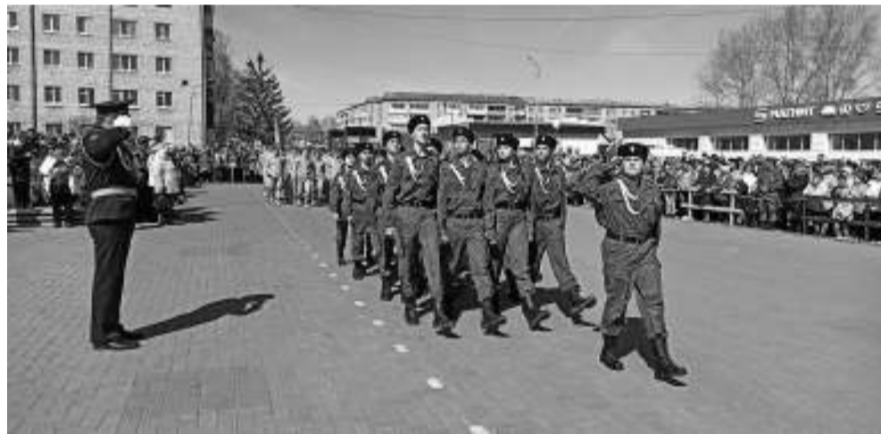
В торжественном строю в казачьей форме маршировали учащиеся школы №5.

люди, прогуливавшиеся и развлекавшиеся на фоне трогательного действия и во время объявленной минуты молчания на территории мемориального комплекса у Вечного огня. Те же, кто пришёл в этот день на площадь почтить память героев, после митинга единым потоком двинулись к Вечному огню и стелам с увековеченными именами асиновцев, сложивших свои головы на поле брани.