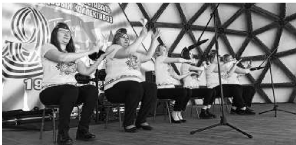
Ежегодные участники фестиваля «Песни Победы» сотрудники детского сада «Радуга» (корпус 1) в этом году играли на деревянных ложках под «Смуглянку».