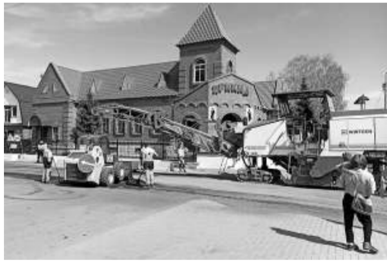
Ведутся дорожные работы на улице Челюскина.

Сегодня должен состояться конкурс на ремонт дороги Асино — Батурино на участке от нулевого до 19-го километра (от крайнего светофора в г. Асино до Казанки). Как мы сообщали ранее, цена контракта составляет около 1 млрд рублей. О своём участии в конкурсе заявило только одно предприятие — Южный филиал ГУП ТО «Областное ДРСУ». Так как участок от Асино до села Ново-Кусково сильно повреждён, ДРСУ, не дожидаясь результатов конкурса, начало проводить там ямочный ремонт.