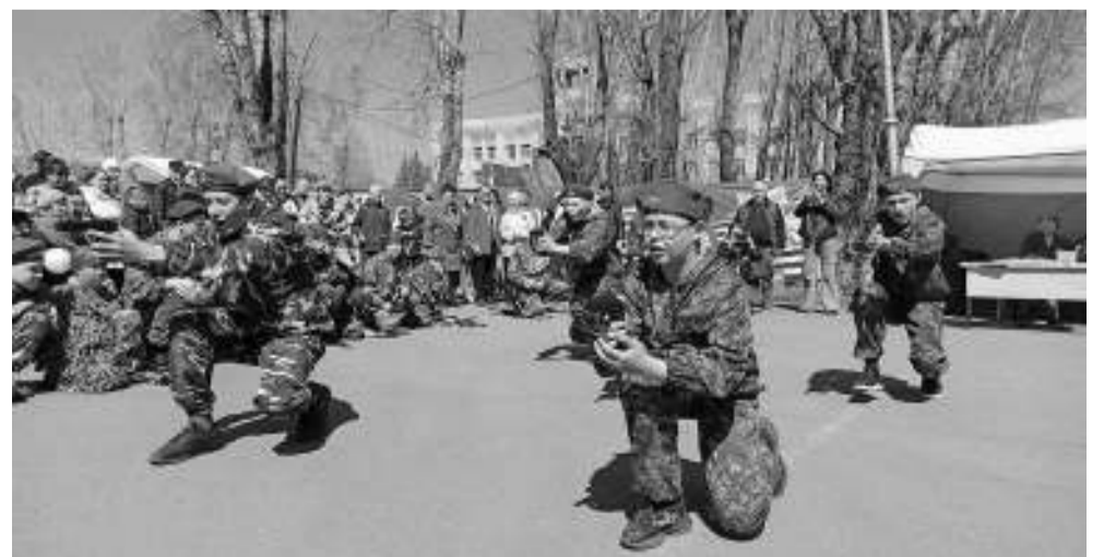
«На привале» — воспитанники военно-спортивного клуба «Баграм».