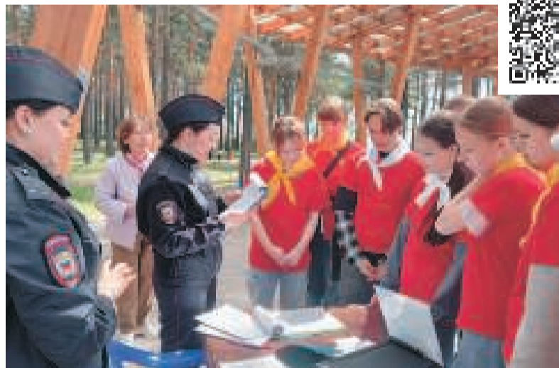
Сотрудники полиции провели с ребятами профилактическую беседу.

1 июня прошло торжественное открытие трудового сезона для асиновских школьников