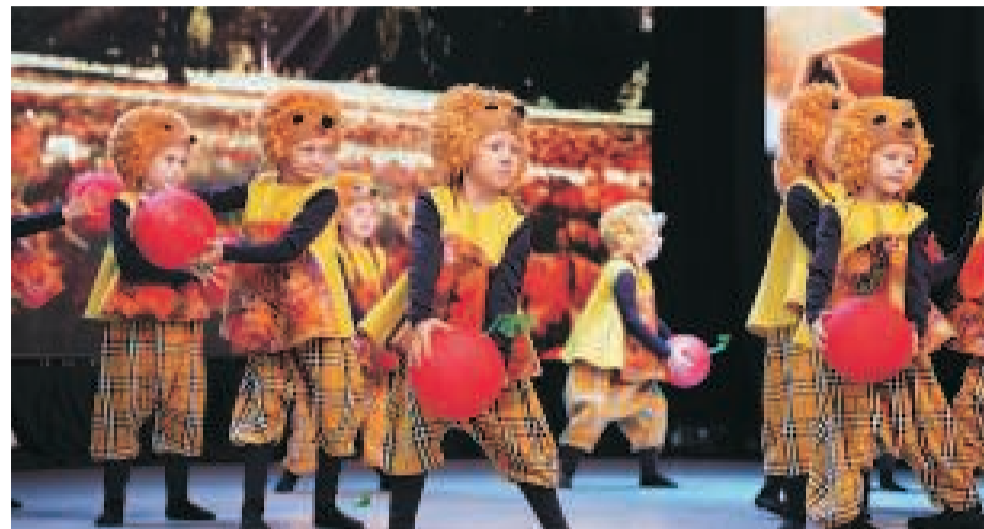
Забавные «Ёжики» развеселили публику.