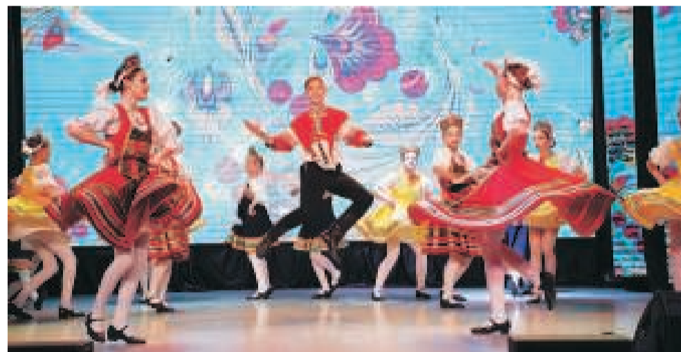
«Калинка» в исполнении старшей группы студии танца «Гравитация».