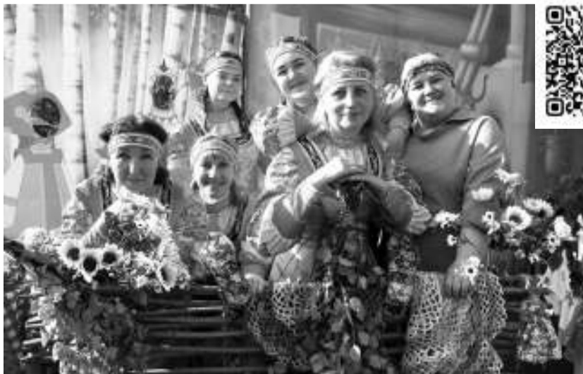
Украсил праздник яркими костюмами и интересной развлекательной программой коллектив детского сада «Журавушка» — один из участников площадки «Русская деревня».

На фестивале было ещё много развлекательных площадок, в их числе музыкальные, где выступали солисты ГДК «Восток», вокально-инструментальные ансамбли «Гараж блюза» и «Снова вместе». Большой, весёлый, познавательный и разнообразный праздник «Золотая береста» завершился выступлениями творческих коллективов Кемеровского государственного института культуры на главной фестивальной площадке. Вот так ярко асиновцы первыми в регионе открыли череду летних межрегиональных фестивалей Томской области. На очереди — «Янов День» в с. Берёзовка Первомайского района.