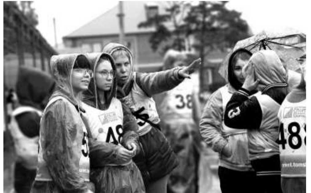
Пять минут до старта: участники планируют маршрут.

Точки обхожу по кругу, от края к центру. Наверное, это неэффективно, но такой план показался самым логичным. Деревья в горсаду растут неплотно, контрольные призмы хорошо видно издали. В путевом листе значилась загадочная точка «R», не отмеченная на карте. Опытные ребята подсказали, что этой буквой отмечена точка 45. Она резервная — на случай, если где-то вы отметились неправильно. Соревнующиеся не только играли на результат, но и