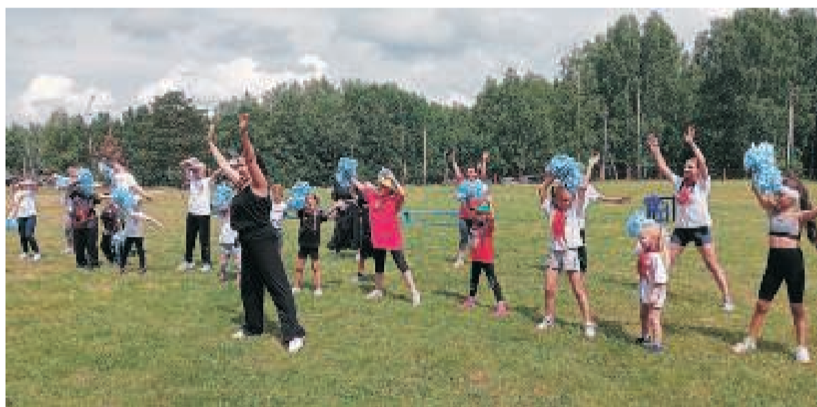
Эстафета завершилась финальным флэшмобом.