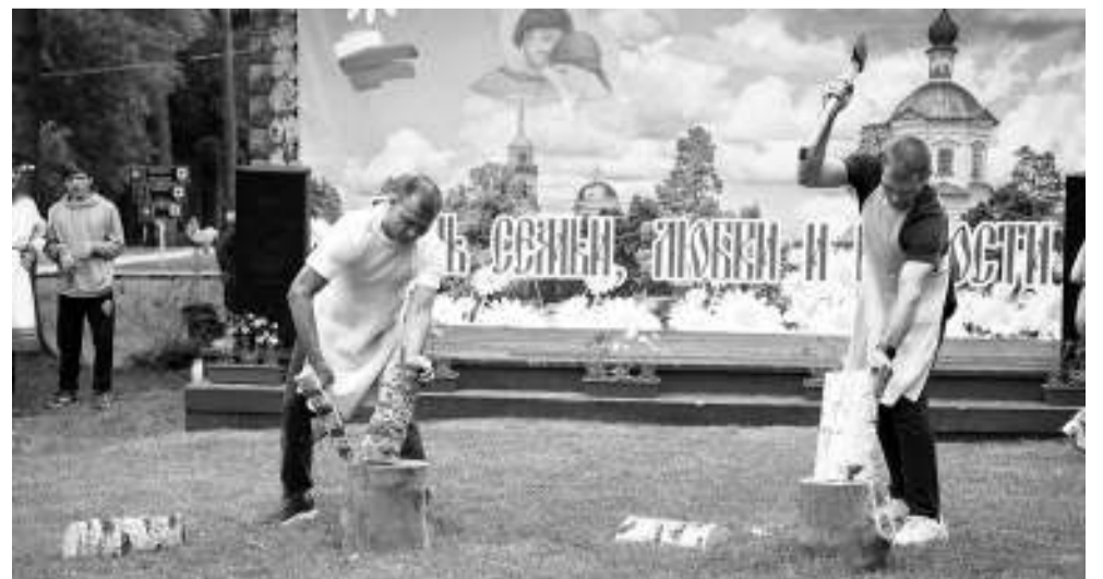
На одном из этапов конкурса главы семей должны были продемонстрировать свои навыки в рубке дров.