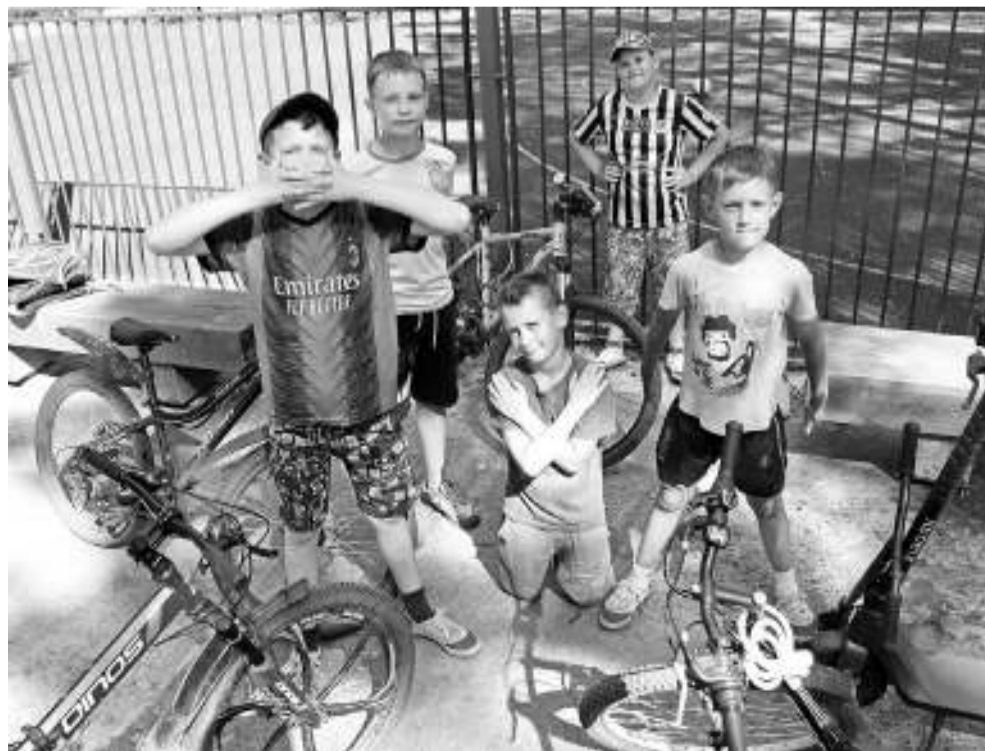
Друзья-футболисты часто приезжают на спортивную площадку в горсаду на тренировки.

Каждое лето велосипедисты добавляют головной боли сотрудникам Госавтоинспекции. По их данным, в прошлом году на дорогах Асиновского района пострадали 7 человек, за первый летний месяц этого года – двое. В обоих случаях взрослые велосипедисты не убедились в безопасности манёвра при повороте. К счастью, обошлось без серьёз-