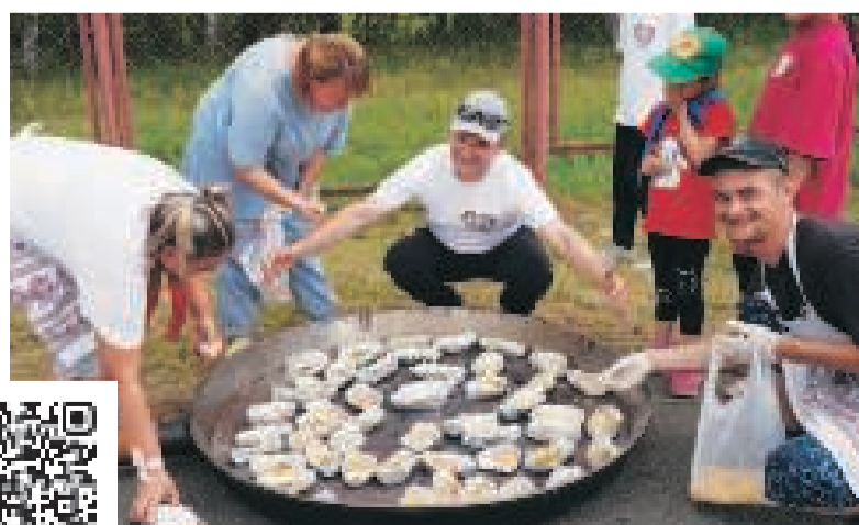
Кулинарный поединок завершился дружным приготовлением яичницы.