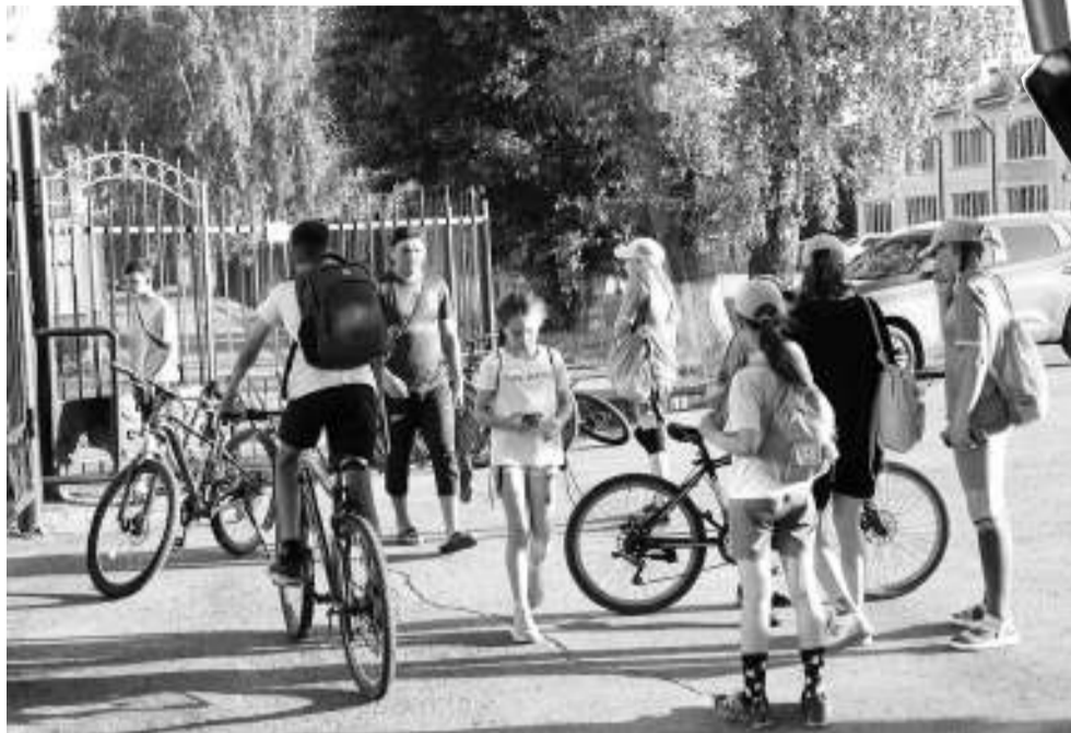
Велосипедная парковка у стадиона «Юность» никогда не пустует.

На площадке для мини-футбола в горсаду играли пятеро мальчишек из четвёртой школы. Ребятам 9 – 12 лет. Мечтают стать игроками профессиональной лиги, как их любимые футболисты. А пока постоянно тренируются. На площадку приехали на велосипедах и самокатах. Это не только быстрее, чем