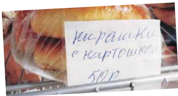
Хотела купить пирожки, а мне продали «пирашки».