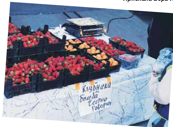
Честно говорю, мне понравился маркетинговый ход одного из местных предпринимателей.