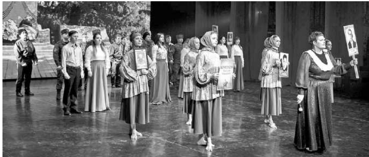
Асиновцы представили на конкурс театрализованную программу «Санька. История одного подвига». На фото — финальный выход.

Областной конкурс патриотических тематических программ «Муза, опалённая войной» открыл XIII Губернаторский фестиваль народного творчества