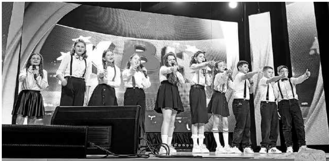
Школьники из «Быстрых кед» уже четыре года играют в КВН. За это время дети выросли, в том числе и в юморе.