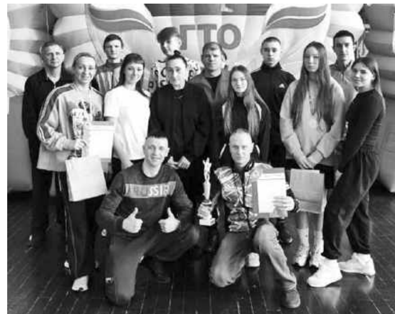
Зырянцы довольны своими результатами.