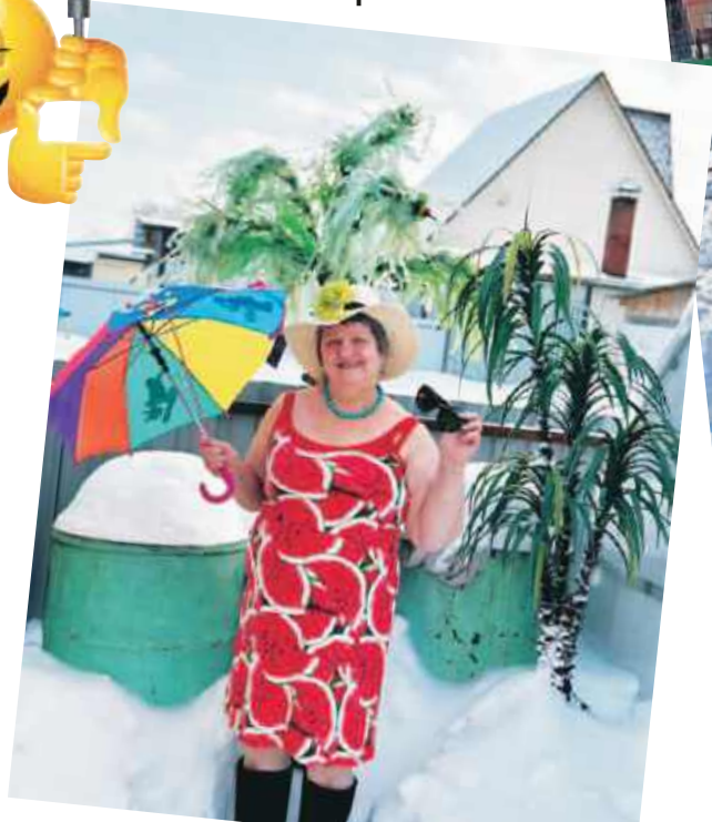
Прилетела на Мальдивы, а там снега по колено, как у нас в Сибири...