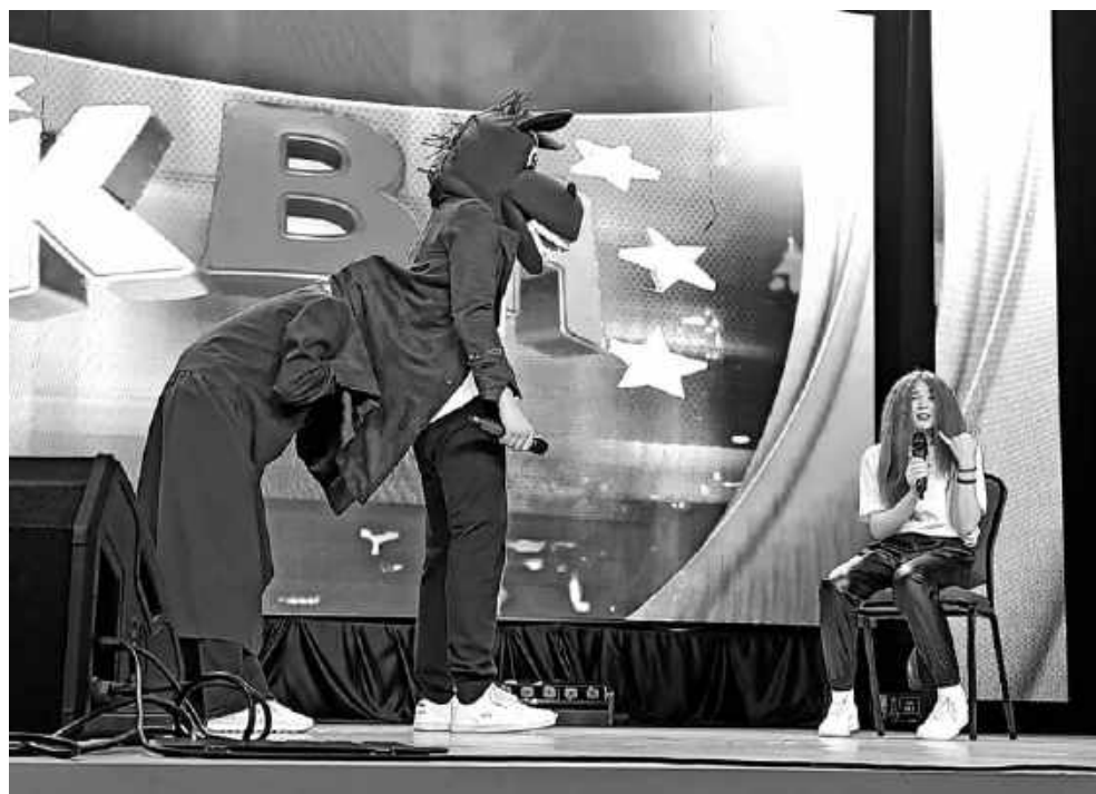
В миниатюре от будущих медиков «конь в пальто» пришёл грабить банк.

Школьники из «Быстрых кед» за те четыре года, что выходят на кавээнсов-