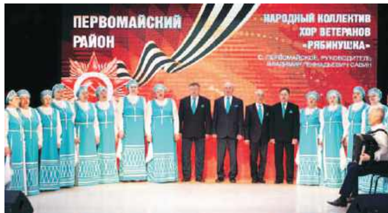
Выступает народный коллектив хор ветеранов «Рябинушка» из с. Первомайского.