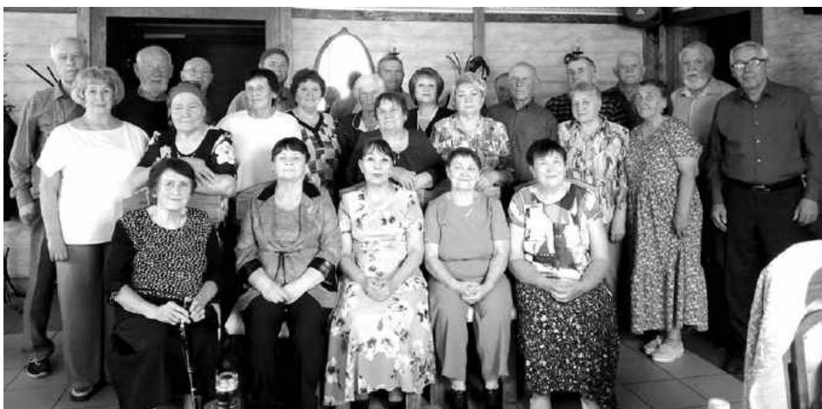
Вместе встретить профессиональный праздник решили ветераны асиновской строительной отрасли.

Именно 70-80-е годы стали временем самого массового строительства в Асине. Бурными темпами возводились жилые дома, объекты соцкультбыта, крупные предприятия. Свой вклад в преобразование родного города вносили представители всех строительных специальностей: мастера, прорабы, водители, отделочники, каменщики, монтажники, геодезисты, сметчики. Сегодня эти люди давно на заслуженном отдыхе, но многие продолжают поддерживать связь и даже вместе отмечать профессиональный праздник. Эту добрую традицию заложили много лет назад быв-