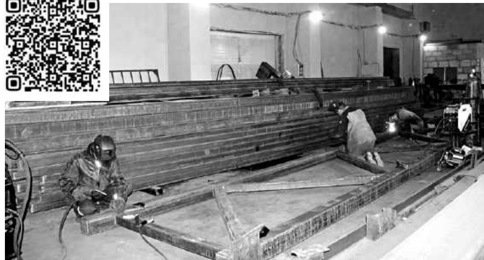
Производственные площадки ООО «Альфа Констракшн» расположены на территории бывшего ТРЗ.