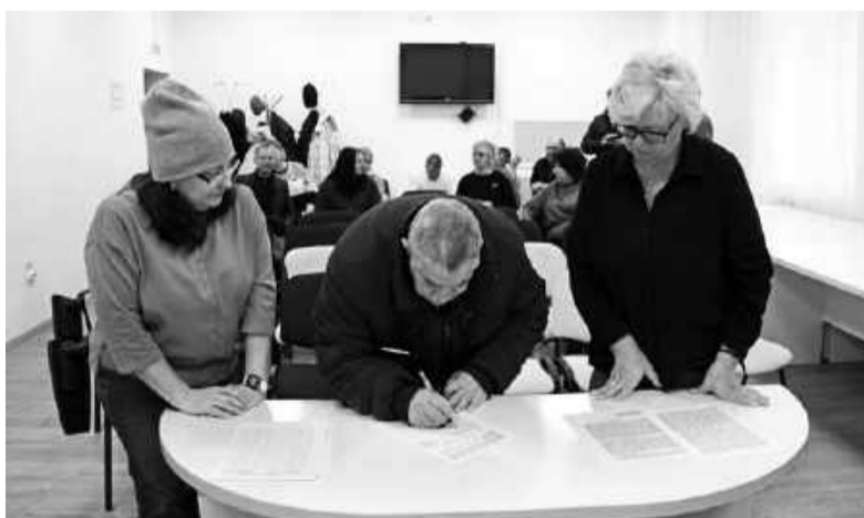
Предприниматели подписывают обращение, адресованное губернатору, председателю и депутатам облдумы.

В сентябре 2025-го неожиданно для бизнес-сообщества Минфин выступил с инициативой о снижении предельной суммы дохода по патентной системе до 10 миллионов руб-