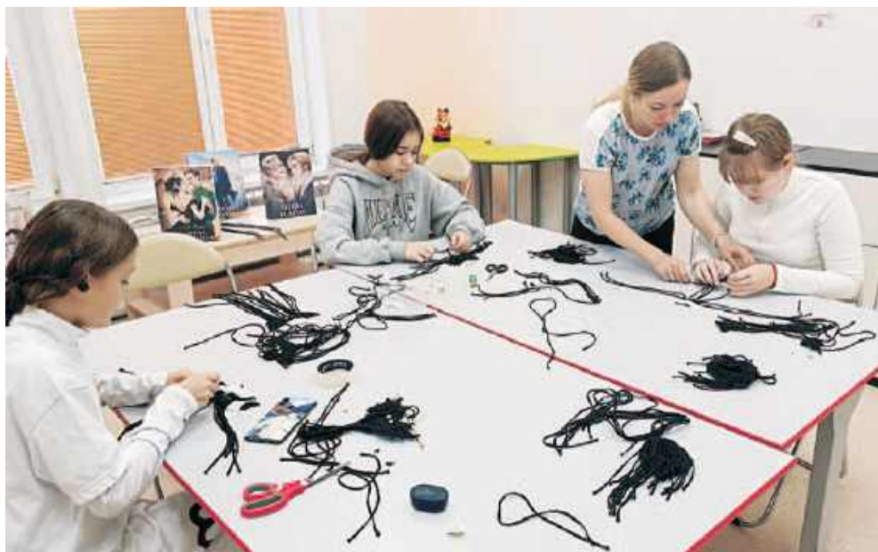
Мастер-класс для школьников был посвящён празднику Хеллоуин: дети делали летучую мышь.