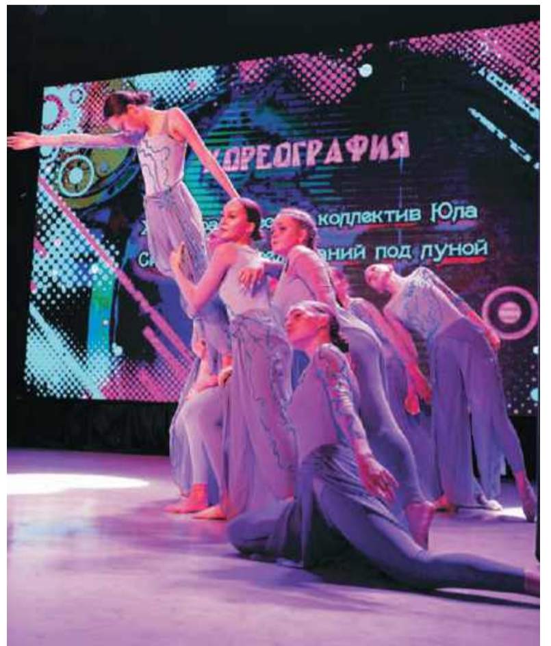
Номер «Симфония переживаний под Луной» принёс победу танцевальному коллективу «Юла».

Если давать общую оценку, творческие эксперименты асиновской молодёжи оказались довольно интересными. Такой фестиваль даёт им прекрасную возможность для самовыражения, а сцена служит хорошей площадкой для раскрытия творческого потенциала.