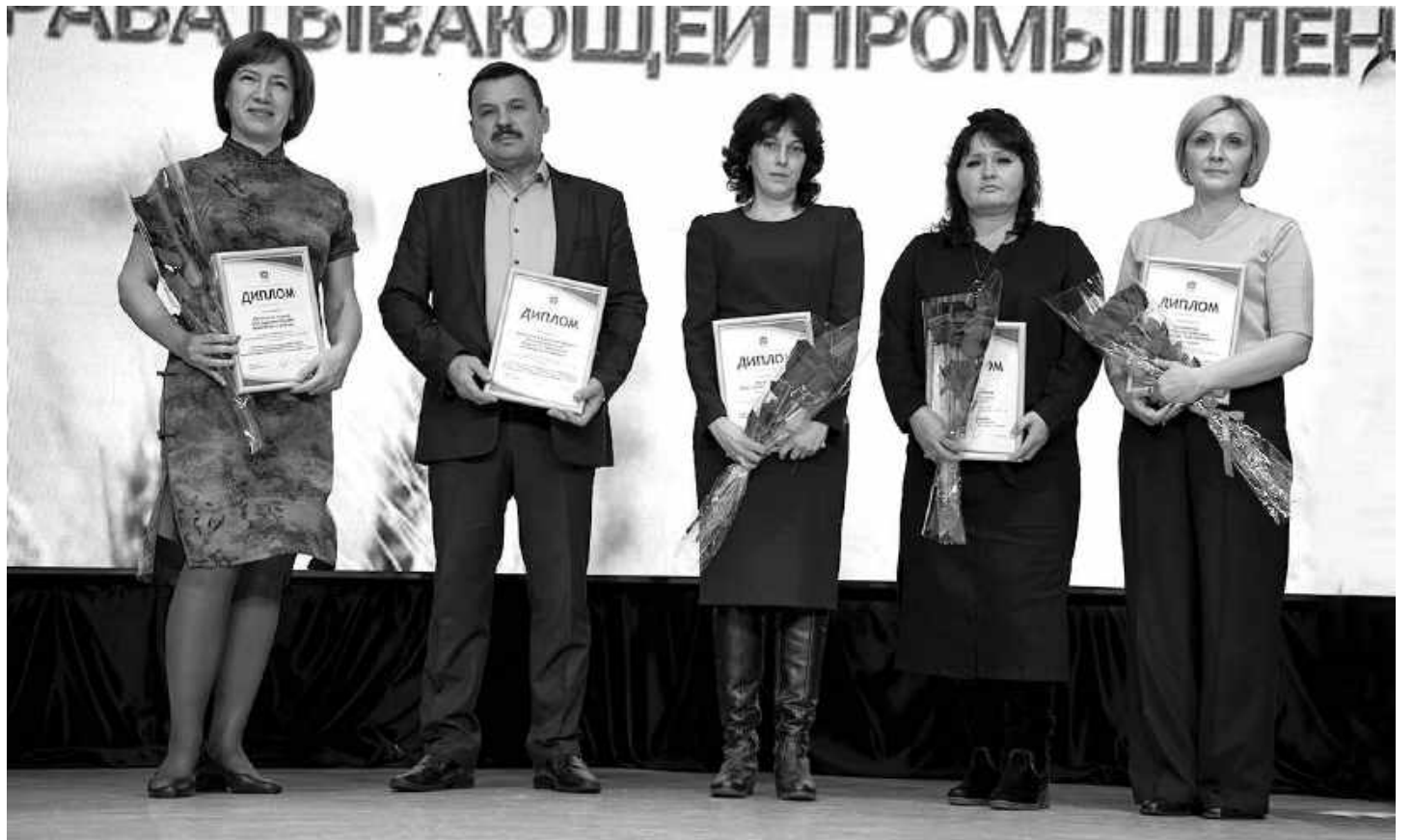
Призёры конкурса среди работников агропромышленного комплекса.