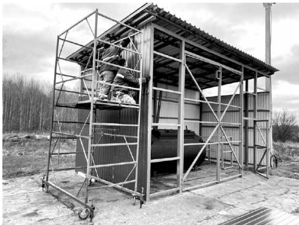
Рядом с убойным цехом предусмотрен крематор вместимостью 1 тыс. кг для утилизации биоотходов.

— Несколько лет назад я была в Якутии и видела подобный убойный цех, построенный по программе Минсельхоза. Там всё чисто, аккуратно, современно, цивилизовано. Запуск специализированного убойного цеха в Асиновском районе позволит местным хозяйствам и фермерам сокращать издержки и время на пути готовой мясной продукции к потребителю. Уверена, что услугами цеха воспользуются и жители других районов, где тоже есть в них острая потребность. Без них, особенно в сегодняшних условиях, когда ужесточаются требования к качеству продукции, невозможно представить развитие агропромышленной сферы.