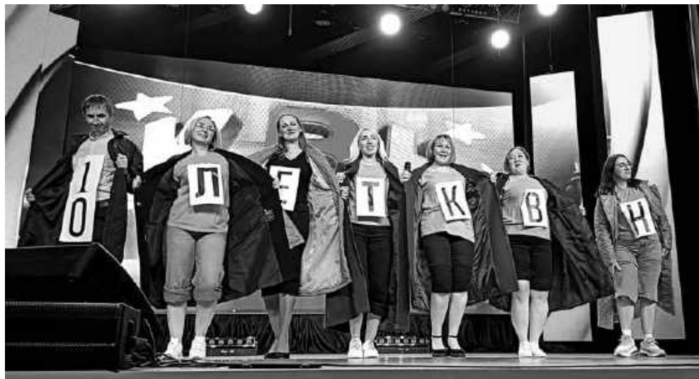
Вот таким оригинальным было поздравление с юбилеем от команды «Окей, Гоголь».