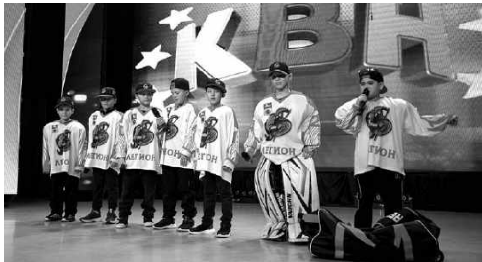
Шутки от дебютантов, команды «Всё хоккей», попадали прямо в цель.