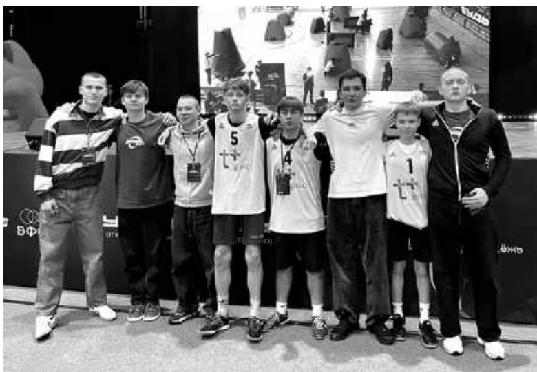
Команда футболистов (с запасными игроками).

Поясним, что в фиджитал-спорте, объединяющем соревнования в двух форматах — цифровом и физическом, можно продемонстрировать себя и как спортсмена, и как знатока виртуальной игры. Состязания проходят в два этапа: участники соревнуются в симуляторе или компьютерной игре, используя телефон, планшет, компьютер, игровую приставку или очки виртуальной реальности, а на физическом этапе — на