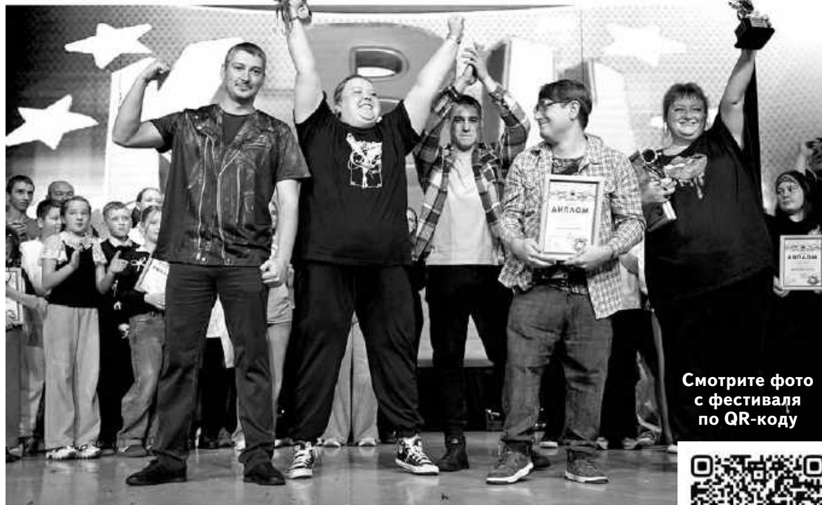
Смотрите фото с фестиваля по QR-коду

«Люди в белом» из Асиновского филиала Томского базового медицинского колледжа, победители прошлого кавээновского сезона, сразу с козырей зашли: выскочили на сцену