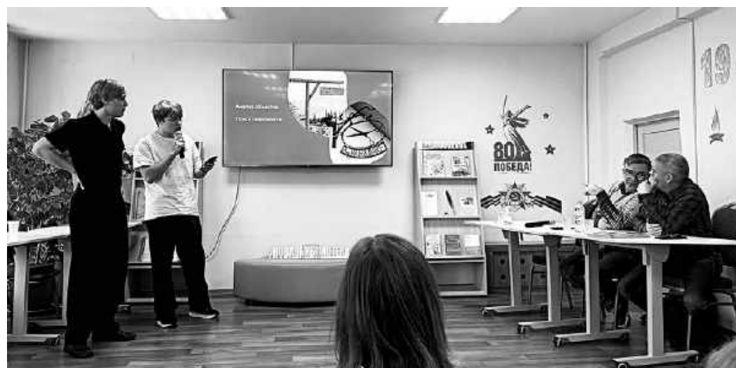
Некоторые идеи ребят из школы №4 эксперты взяли себе на заметку.