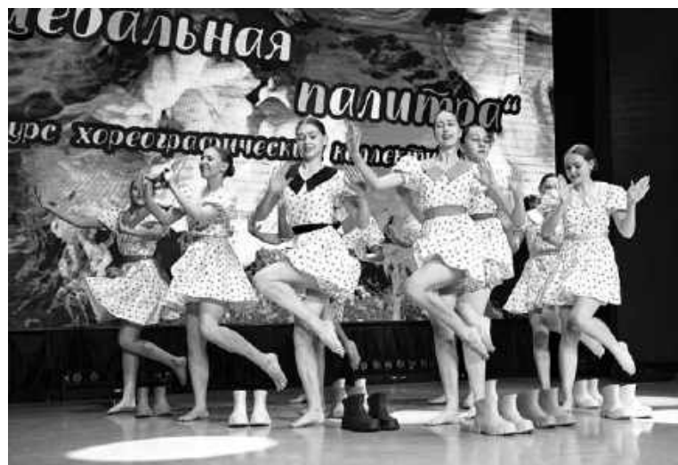
Хореографический коллектив «Юла» представит наш район на областном этапе конкурса.