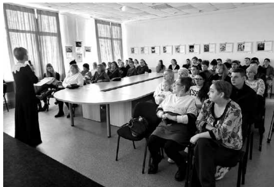
В открытии фотовыставки «СВОи Герои» приняли участие родные и близкие участников СВО.