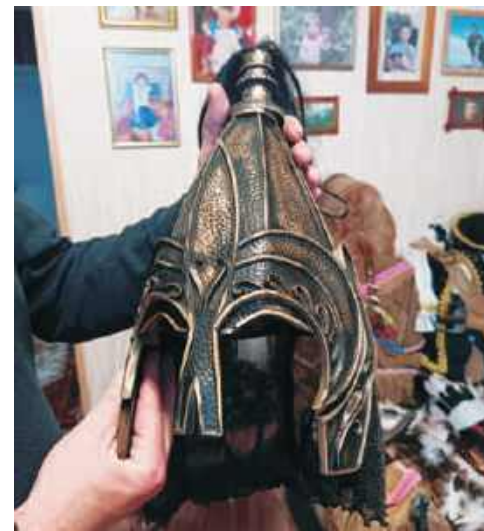
Трудно представить, что этот шлем выполнен из пластика вручную.