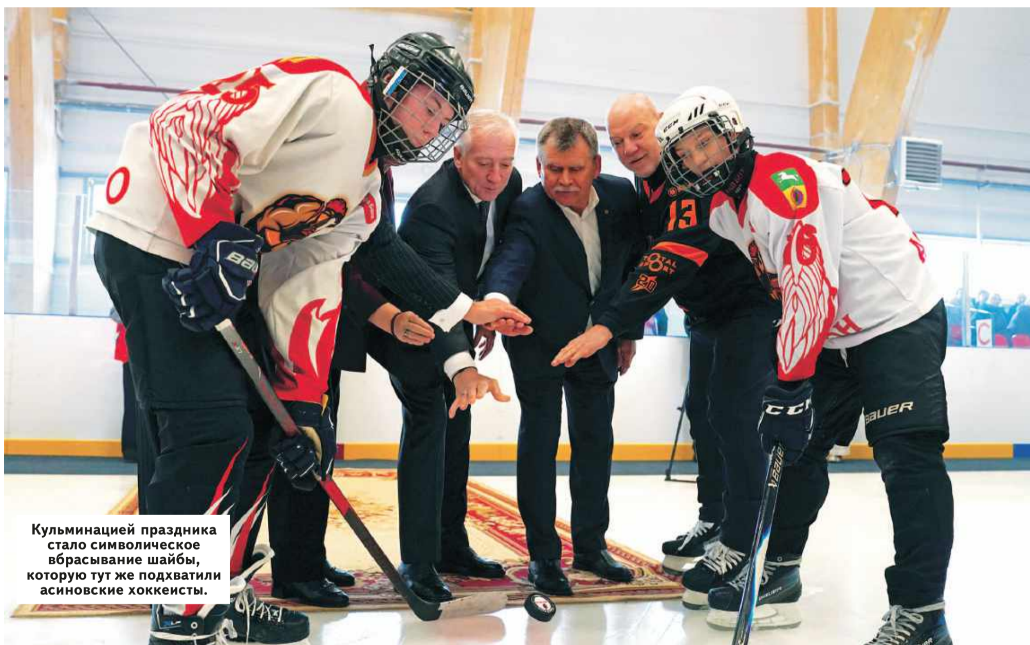
Кульминацией праздника стало символическое вбрасывание шайбы, которую тут же подхватили асиновские хоккеисты.