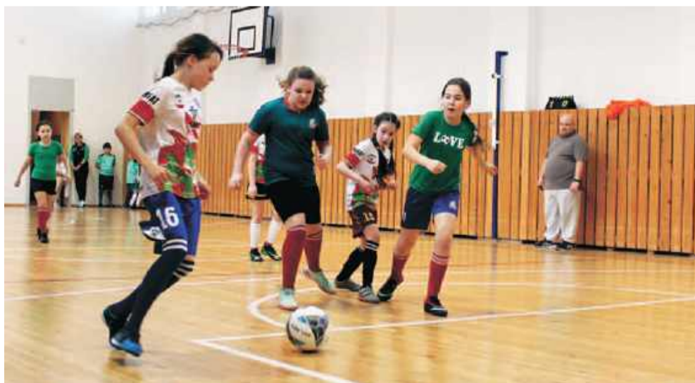
Встреча «Темп» — «Варяг» закончилась со счётом 3:0. Асиновские футболистки — золотые призёры игр!