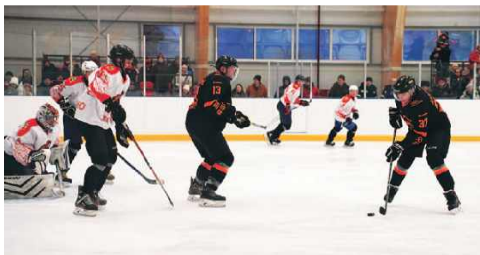
Вечерним гвоздём программы стал матч между асиновскими «легионерами» и командой «Роспресса».

— Создать такой объект мы смогли при поддержке нашего президента, государственной программы «Комплексное развитие сельских территорий» и