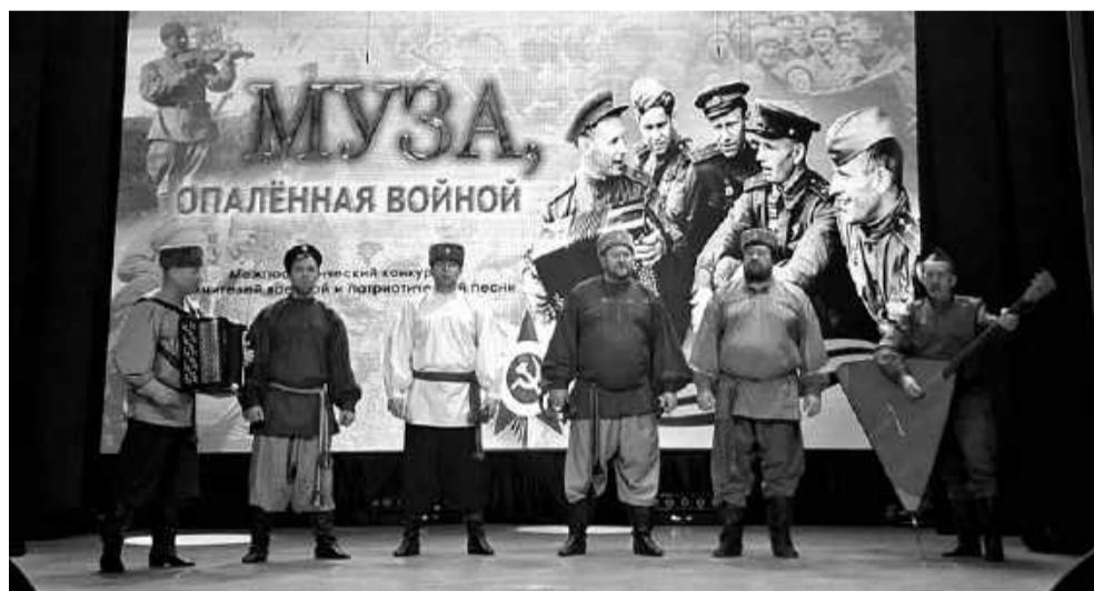
Выступает вокальный ансамбль «Ильин день» (Асино).