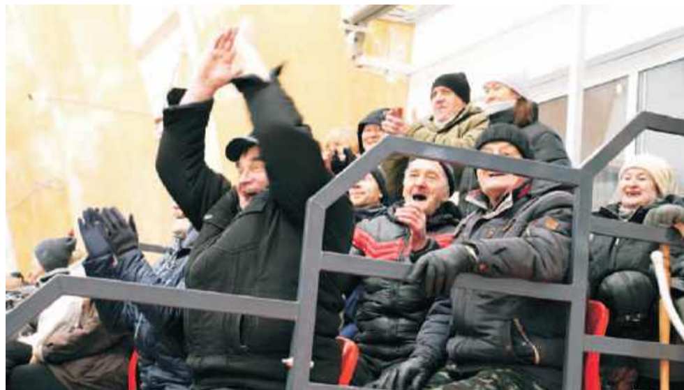
На трибунах было жарко! Яркие и неподдельные эмоции асиновских болельщиков.

Народной программы партии «Единая Россия», — сказал В.Мазур. — Спорт — это здоровье, а важнее здоровья ничего нет. Спасибо всем: администрации района, строителям, подрядчикам, областной команде и, конечно, спортивной общественности за терпение и веру.