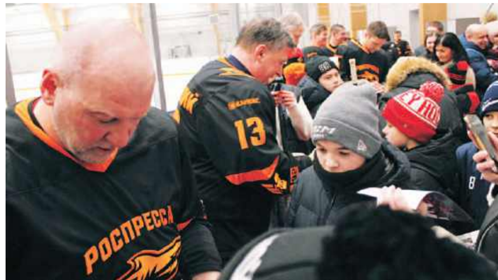
Автографы раздаёт звёздная команда «Роспресса».

Сюрпризом стало выступление президента Федерации хоккея г. Москвы Андрея Николишина: