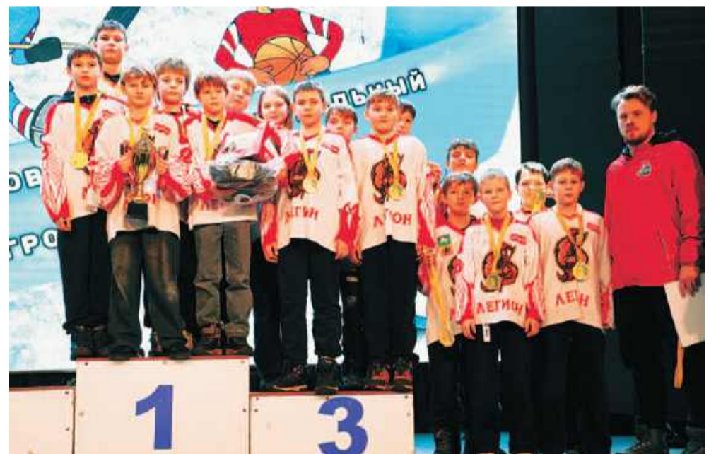
Уже несколько лет подряд победителем фестиваля становится асиновская хоккейная команда «Легион».