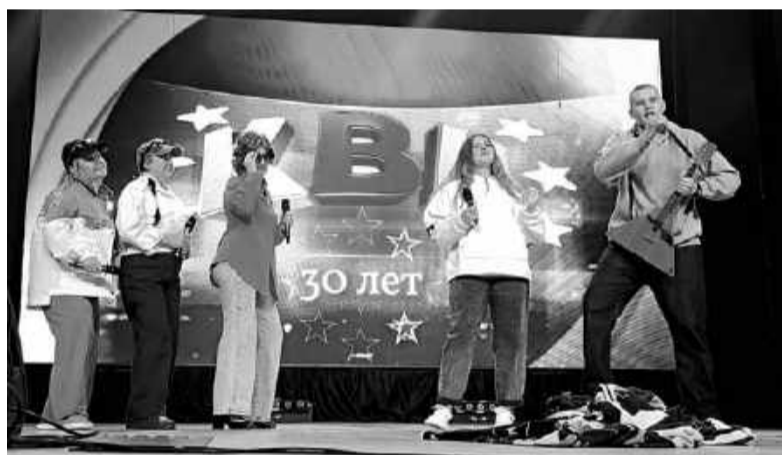
«Люди в белом» выступали за чистоту русского языка.

В этом году Асиновская лига КВН отмечает 30-летний юбилей