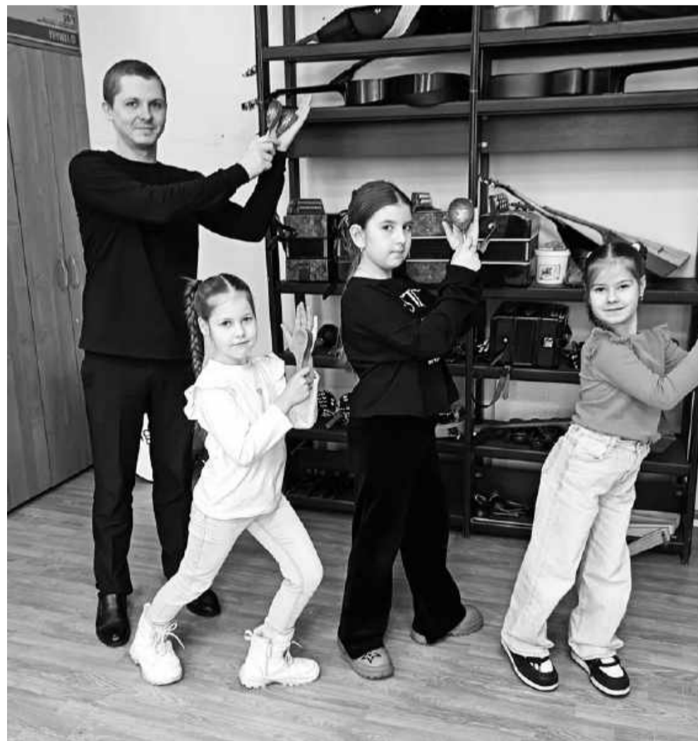
На репетиции участники «Звонницы» приходят с удовольствием.

— Значит, нужно было потратить столько лет, чтобы жизнь привела меня к моему призванию. Я музыкой могу выразить то, чего никогда бы словесно не объяснил, несмотря на наш богатый русский язык. Очень рад, что могу передать свою любовь к искусству участникам коллективов, с которыми работаю, и вместе с ними порадовать нашим творчеством зрителей, затронуть их души.