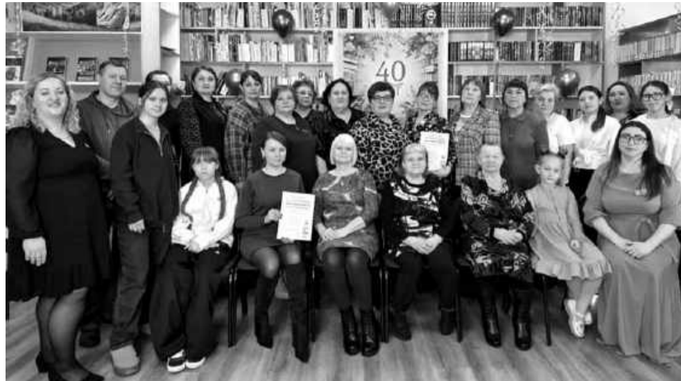
Фото на память в юбилейный день.

Мы, в свою очередь, вручили благодарственные письма за тесное сотрудничество общественной организации «Лучики», гимназии №2, детским садам «Рыбка» и «Солнышко». Кстати сказать, праздничная программа была проведе-