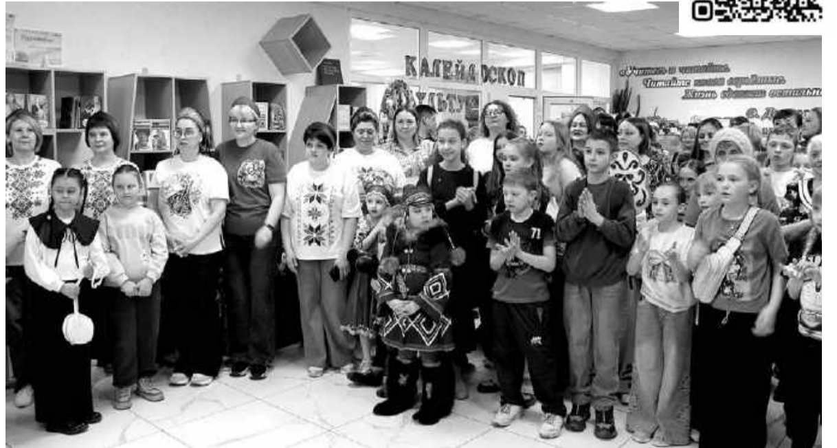
«Библионочь-2026» посетили более 500 человек.

В этом году акция «Библионочь» была посвящена теме «Единство народов – сила России». Чтобы понять и оценить эту силу, достаточно было 17 апреля прийти в БЭЦ