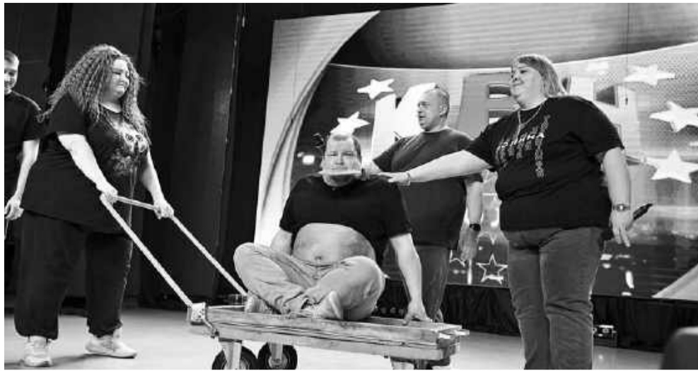
«Люди в теле» в честь юбилея привезли в подарок «денежную жабу».