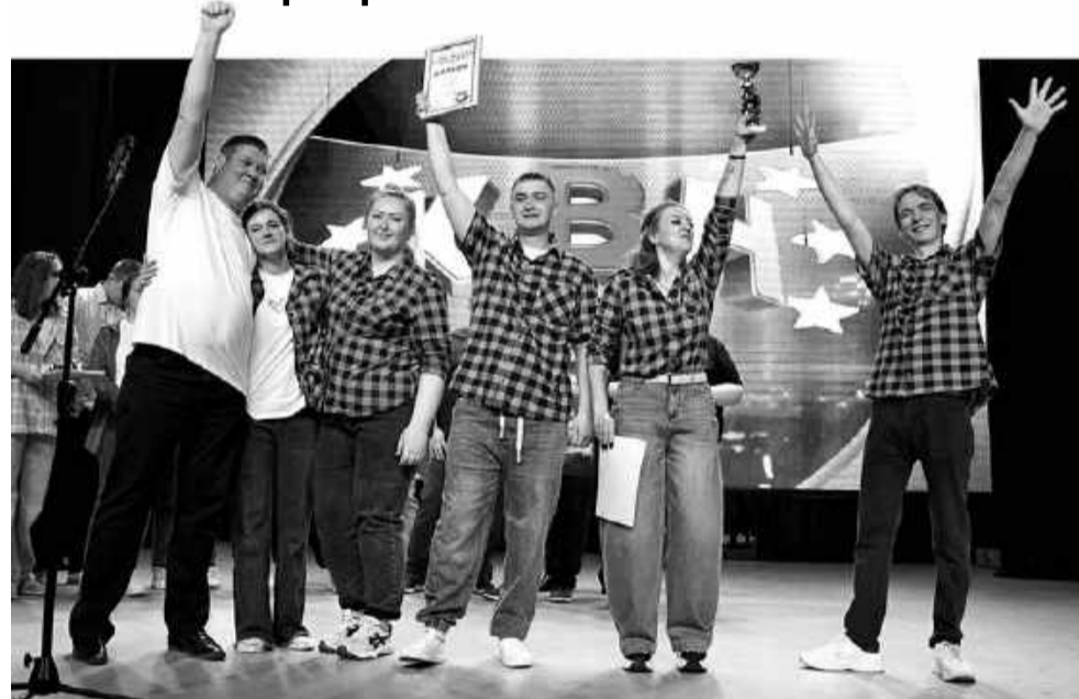
Команда «На 10 лет назад» стала победителем фестиваля.