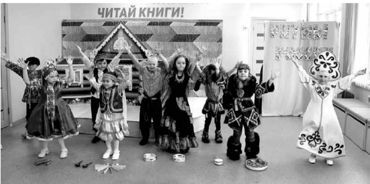
Сказку «Теремок — дружба народов» показали воспитанники детского сада «Пчёлка».

Словом, «Библионочь» в этом году как всегда пролетела на одном дыхании. Всего несколько часов, а ощущение, что побывал в десятках уголков нашей огромной страны — от чеченских гор до тувинских степей, от чувашских деревень до русских селений.