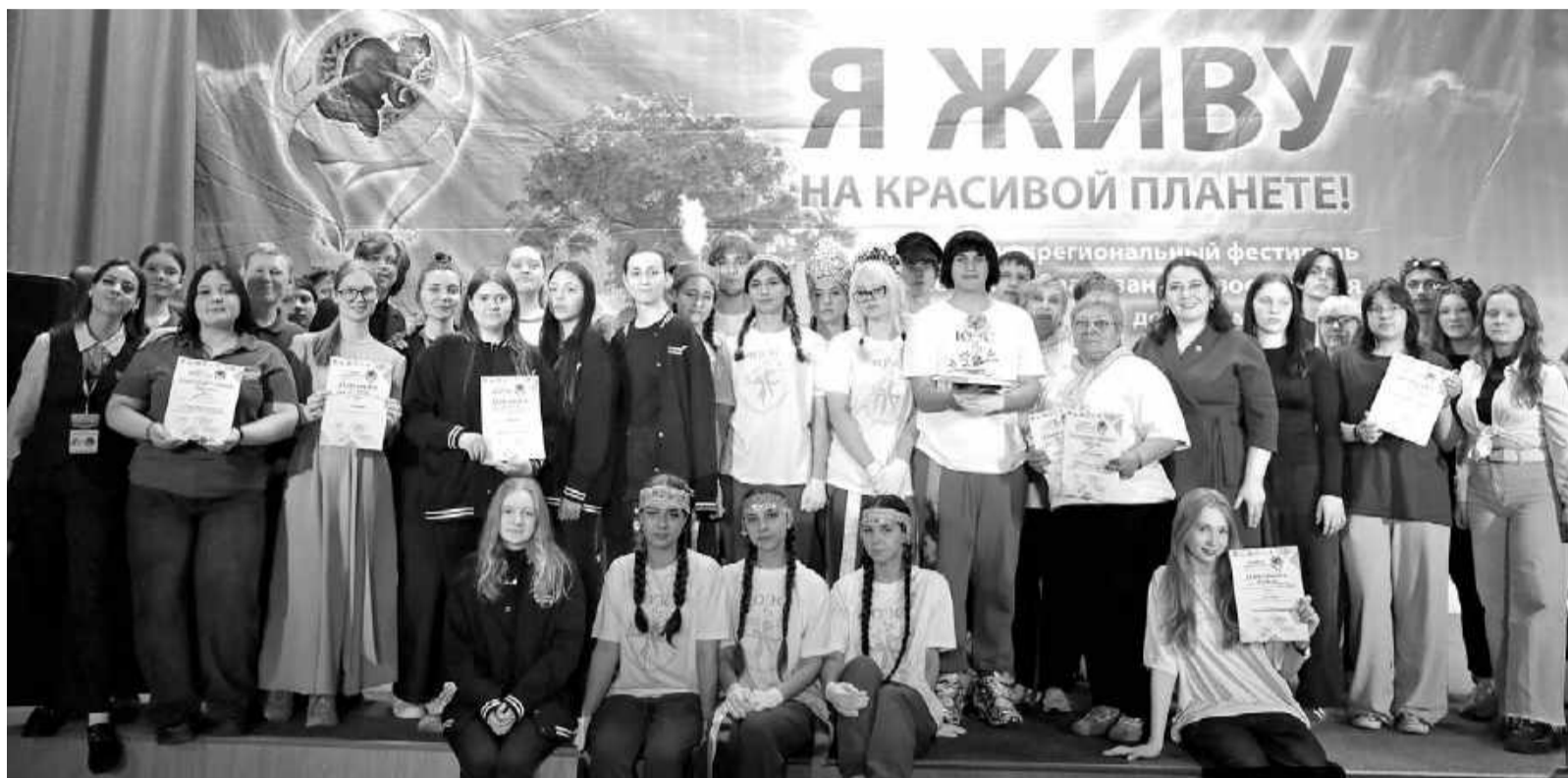
Заслуженные награды получили лучшие.

В этом году участники XXI межрегиональной научно-практической конференции «Экологические проблемы нашего Причулымья» представляли более 100 докладов профессиональному жюри на пяти тематических секциях. Были определены направления: для младших школьников и дошкольников — «ЭкоСтарт»; для других возрастных категорий — «Социальная экология»; «Комплексные исследования экосистем, экология животных и растений»; «Антропогенное воздействие на биосферу и здоровье человека» и «Детское и моло-