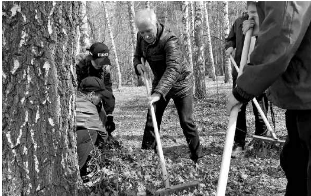
Губернатор Владимир Мазур на субботнике в Лагерном саду.

Городская администрация поработает на площади Ленина с частичным охватом центральной улицы. Районная администрация возьмёт под опеку привокзальную площадь. Водоканал наведёт порядок на площади Победы и прилегающих улицах,