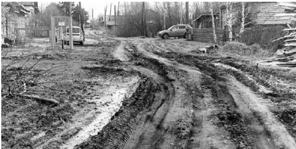
До конца улицы Новой доехать сложно: мешает грязь и глубокая колея.

— Участки уже определены и утверждены решением Совета депутатов. Список уже точно в этом году не будет расширен: всё упирается в бюджет. Но могу сказать, что в следующем году работы продолжатся. Дорожное полотно на некоторых улицах мы восстанавливаем не за один год, если это требуется. Так будет и с улицей Новой.