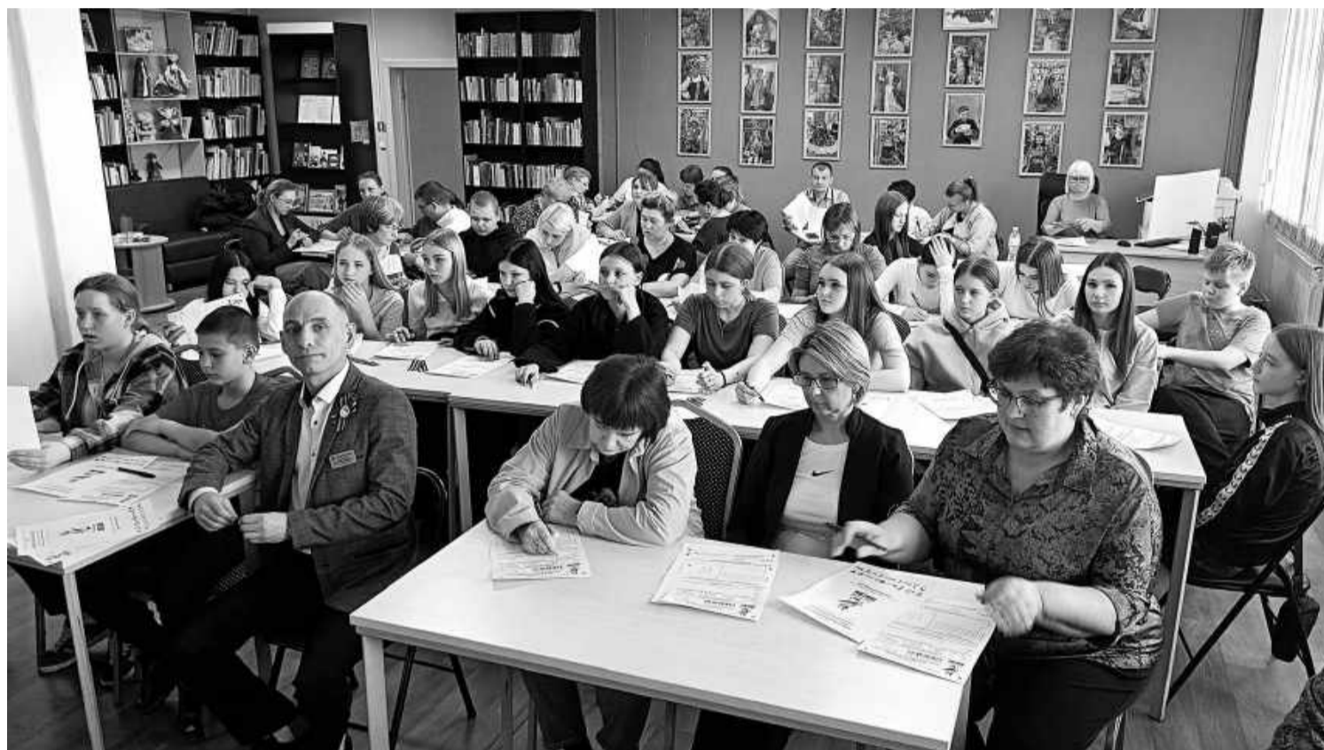
В БЭЦ «Диктант Победы» писали 55 человек.