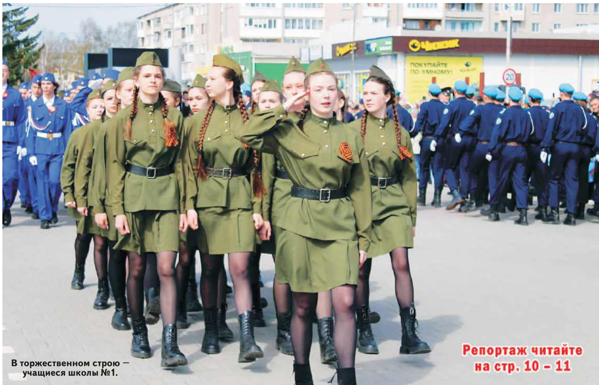
В торжественном строю — учащиеся школы №1.

Асиновцы отпраздновали 81-ю годовщину Великой Победы