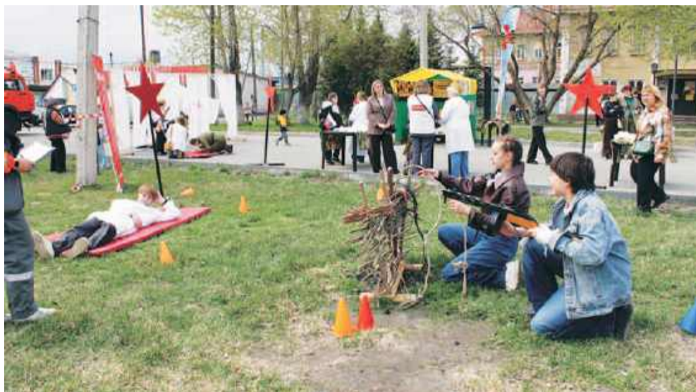
Участники соревнований молодёжных команд «Медик. Зарница 2.0».