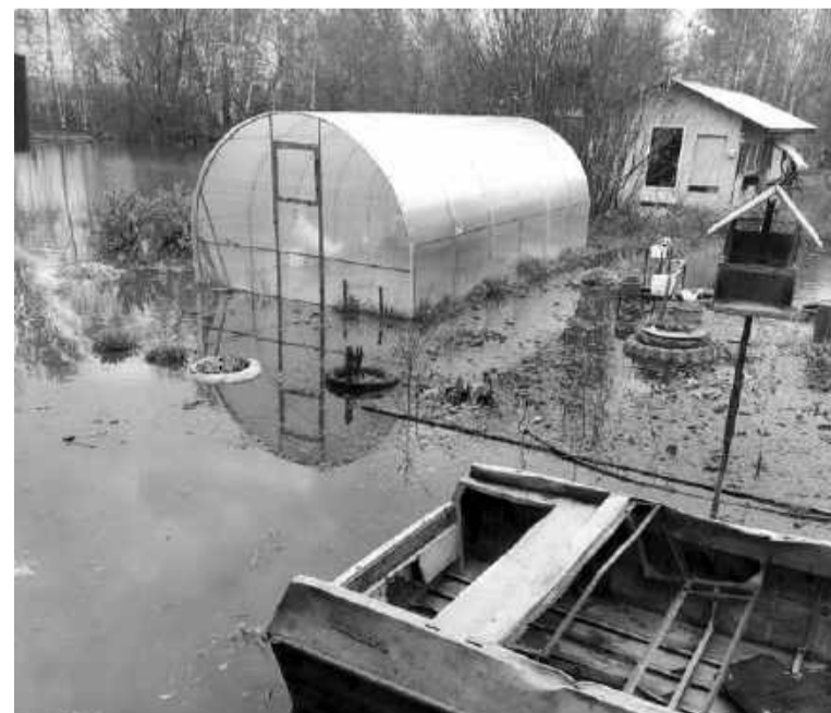
В посёлке Беляя затопило улицы и огороды.

В межотопительный сезон будет производиться и отключение горячей воды в связи с проведением профилактических работ и ремонтом котельного оборудования согласно графику, утверждённому администрацией Асиновского городского поселения и доведённому до сведения населения. Плановое отключение горячей воды и ремонт котельных начнётся уже с первых дней июня.