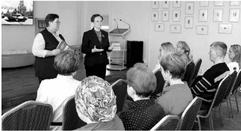
Асиновские библиотеки получили в дар двадцать экземпляров книги «Хроника обыкновенного подвига» (история 166-й стрелковой дивизии).

Теперь Вечный огонь в Асине будет гореть постоянно, соединяя прошлое и настоящее в единое пламя памяти. Он