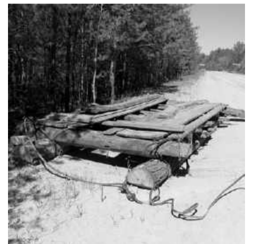
Плот для перевозки машин, сооружённый местным жителем, уже не нужен.