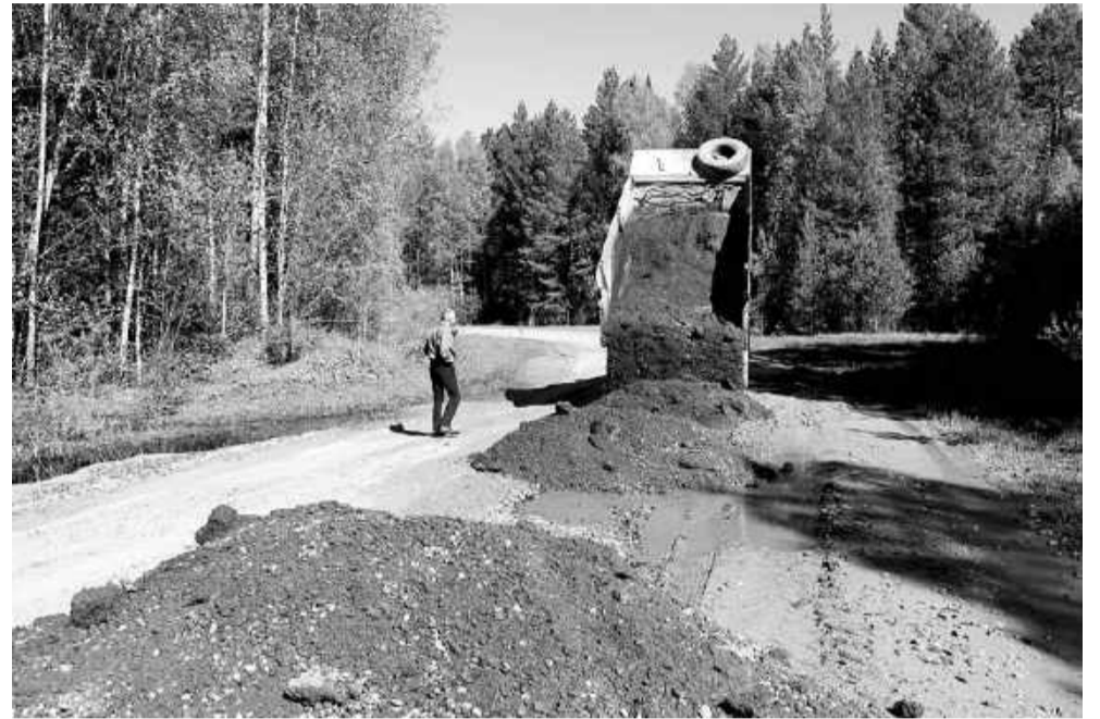
На участках, где ушла вода, стартовали восстановительные работы.

– В мае в нескольких метрах от моста через Малую Юксу образовался первый перелив. Хлынувшая таёжная вода стояла в ямах сантиметров по пятьдесят. Но с неделю назад ушла вме-