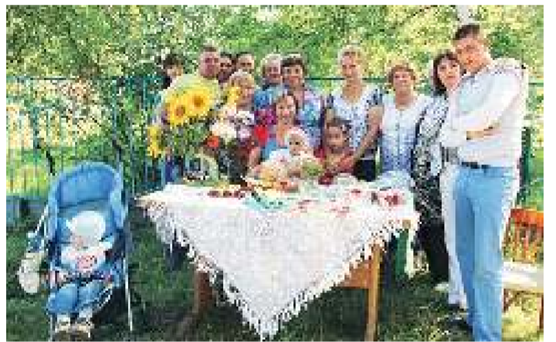
Первыми накрыли свой стол жители улицы Колхозной.