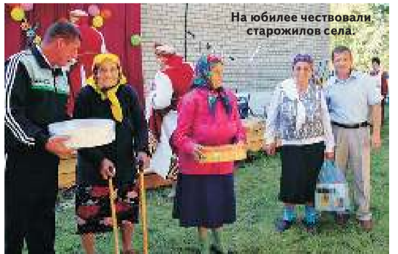
На юбилее чествовали старожилы села.