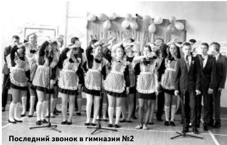
Последний звонок в гимназии №2